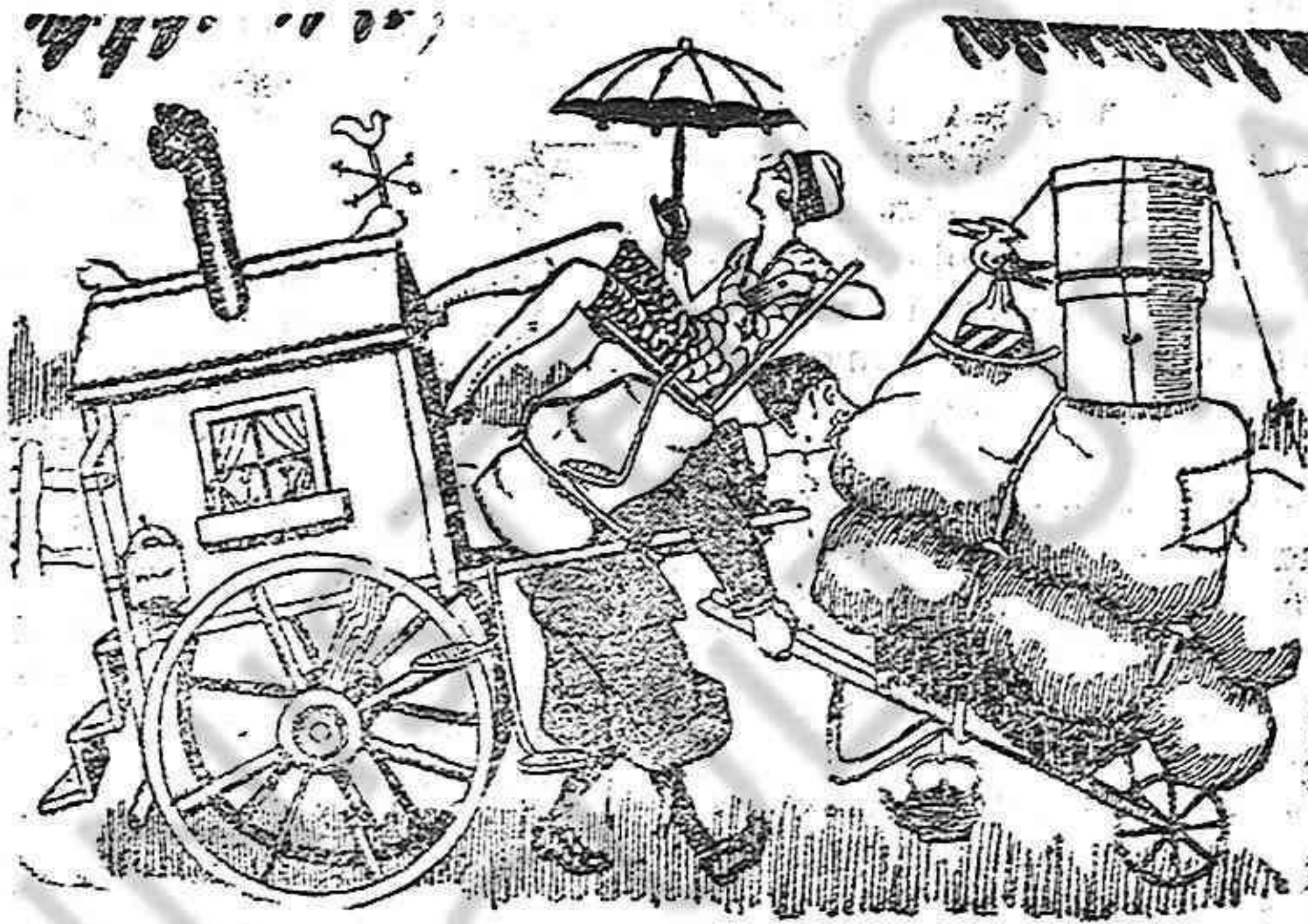
EU: N'hi ha que diuen que van tirant; jo... vaig tirant... i empenyent.