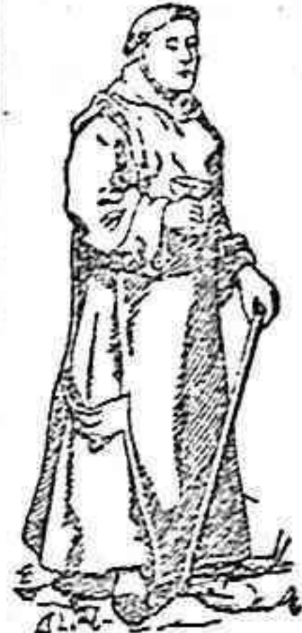
La naturaleza produce todo lo necesario al hombre para su salud, sentir y curarse.

compuesta únicamente de plantas medicinales