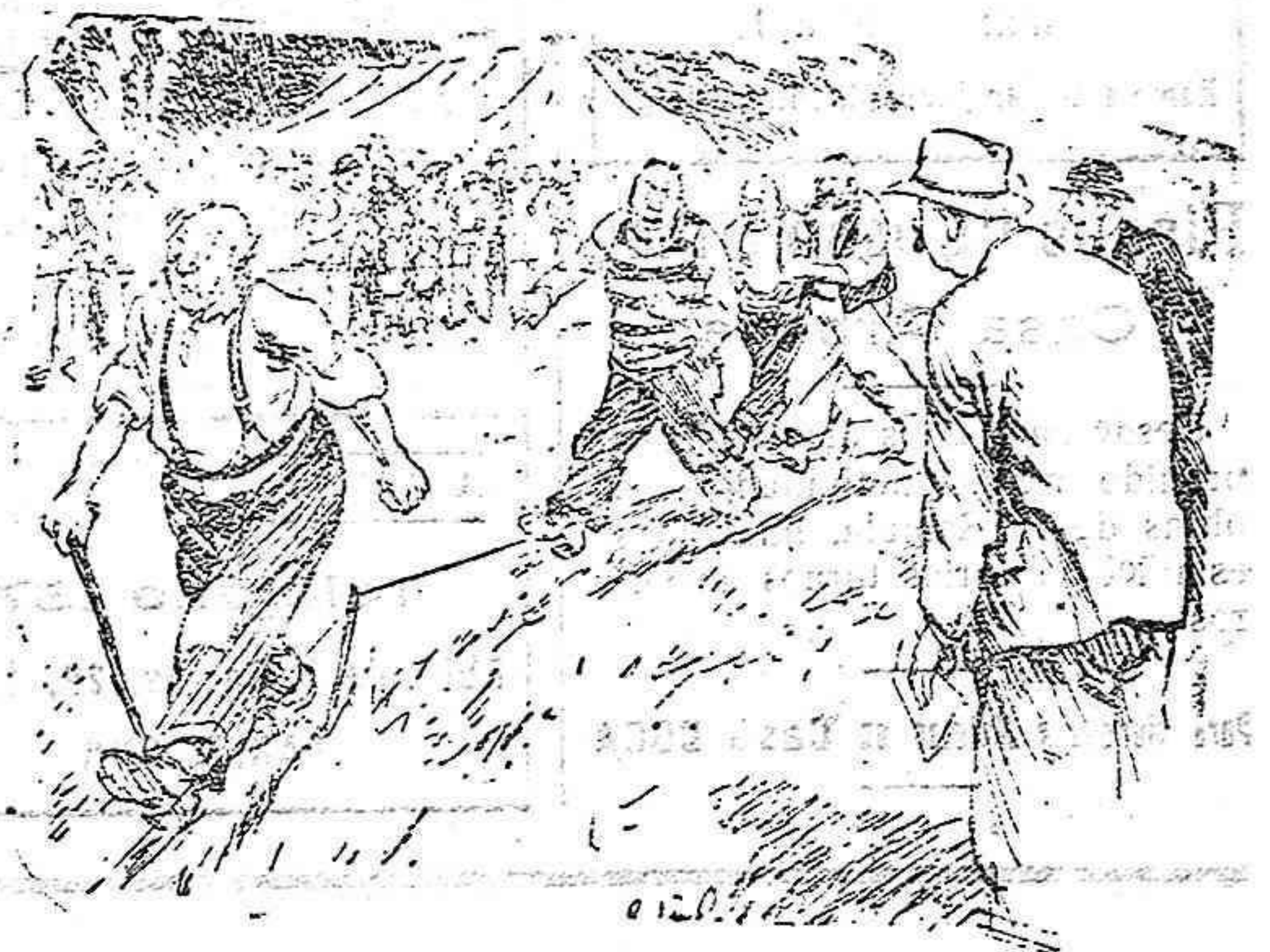
Un competidor:—No s'hi val! Aquell s'apoya amb un bastó!