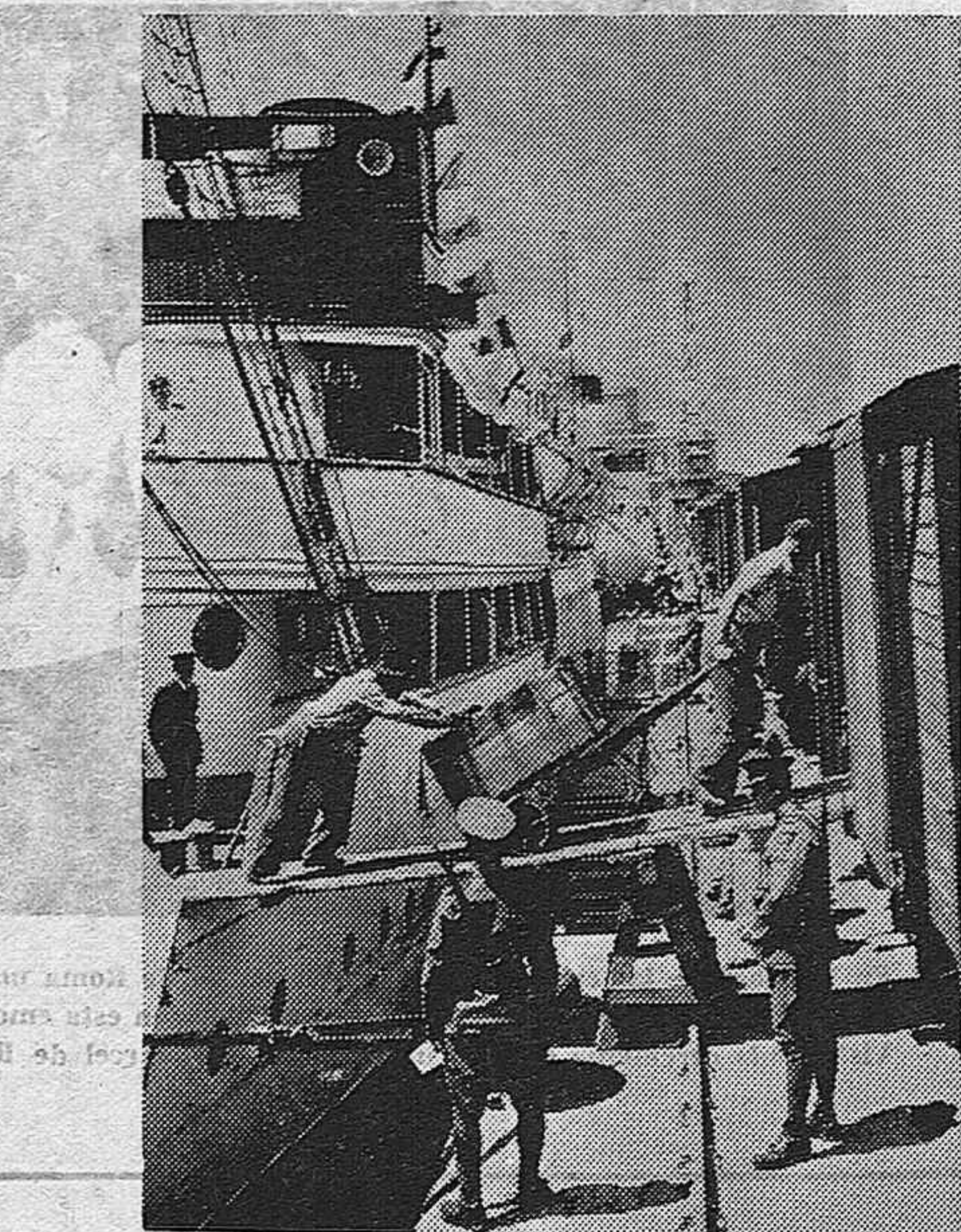
Después de las nuevas relaciones entre la U. R. S. A. y Rumania, Rusia restituye los tesoros y documentos rumanos de los cuales era poseedora desde la Guerra. Descargamento en Constancia de documentos y objetos preciosos procedentes de Rusia.