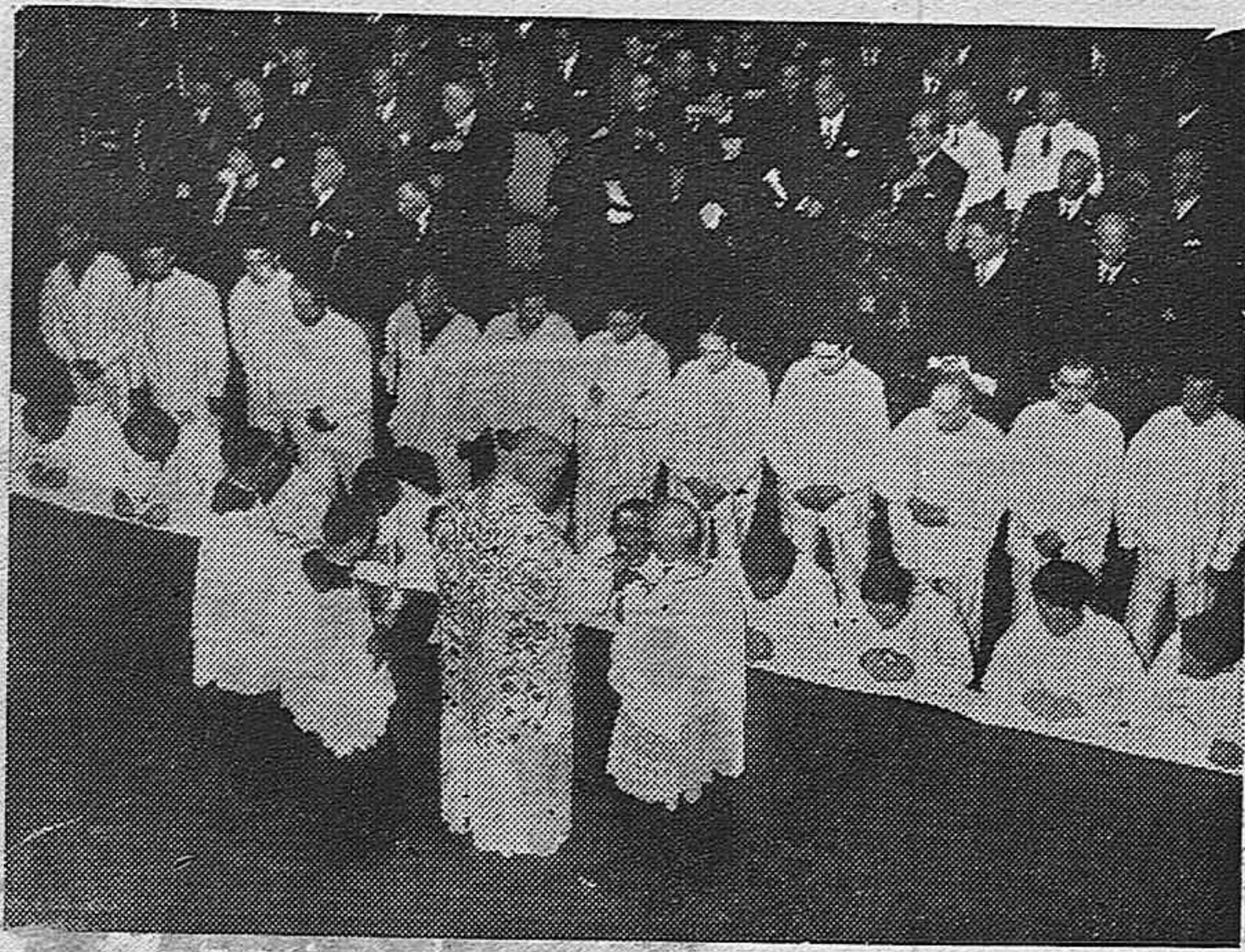
En la época de las comuniones, los prisioneros de Roma no son olvidados y los que aún no han comulgado (que son muchos) son admitidos en esta emocionante ceremonia. Vista de la ceremonia de la comunión en una cárcel de Roma.