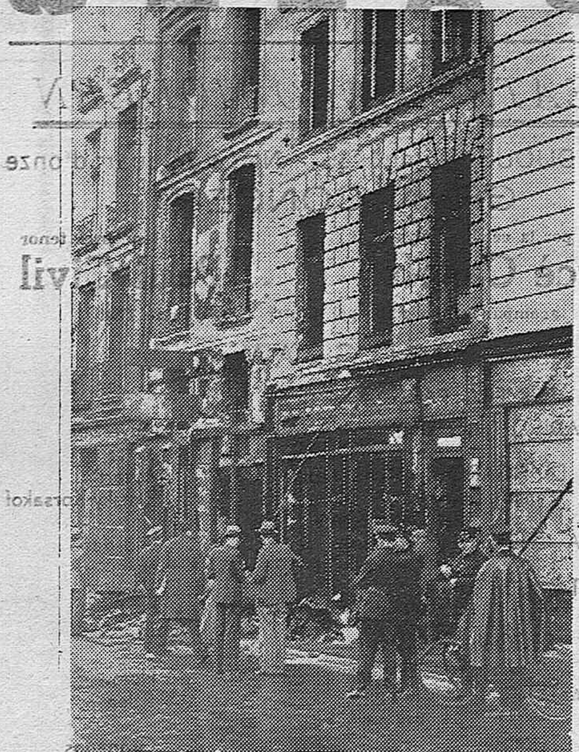
En el "Quai des Grands-Augustins" se declaró un incendio en un camión, el cual se propagó a las casas inmediatas, resultando un muerto y diez heridos. Quince familias han quedado sin albergue. El sitio del siniestro después que los bomberos hubieron sofocado el fuego.