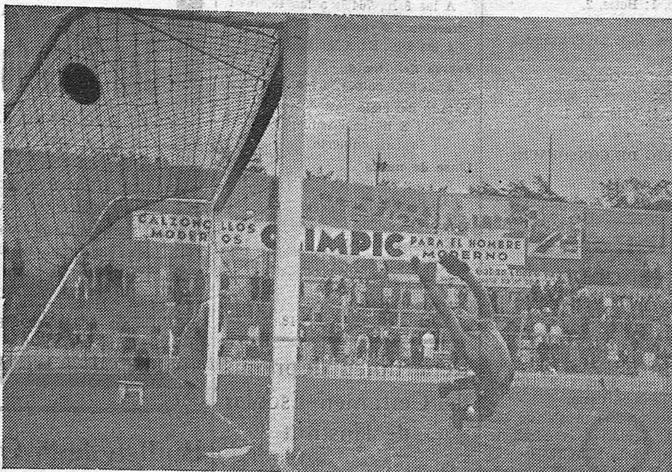
Se celebró en el campo de Chamartín de Madrid, el partido de futbol entre los equipos Sunderland y una selección de Castilla con un resultado de 2 a 1 en favor del Sunderland. El primer goal de los ingleses, que Pacheco no pudo detener.