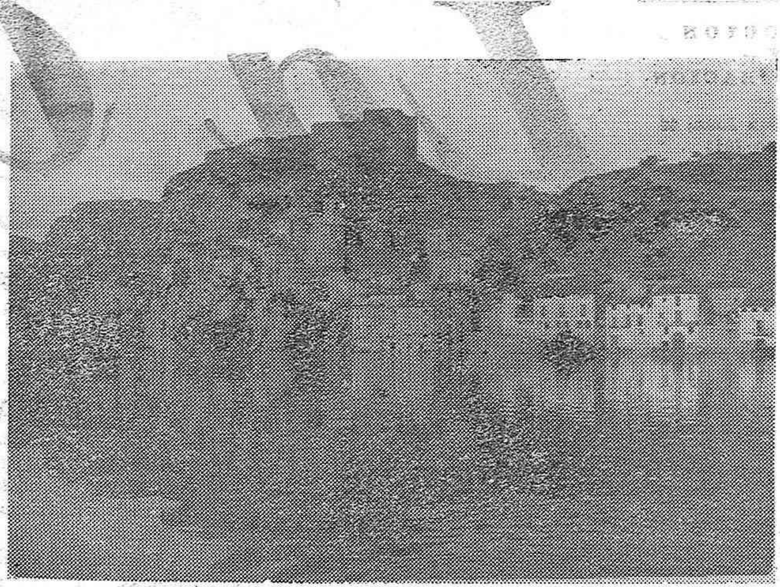
Efectos del desbordamiento del Ebro en Miravet

A la 1'10: "Marina" (fragments) A la 1'20: "Anant al Bosc" i "Veint del Bosc" (potpourris). A la 1'30: "Aida" (òpera). A la 1'40: "La Verbena de la Paloma" (fragments). A la 1'50: "La Mala Sombra" (fragments). A les 2'00: Música de jazz. A les 3'00: Fi de l'emissió.