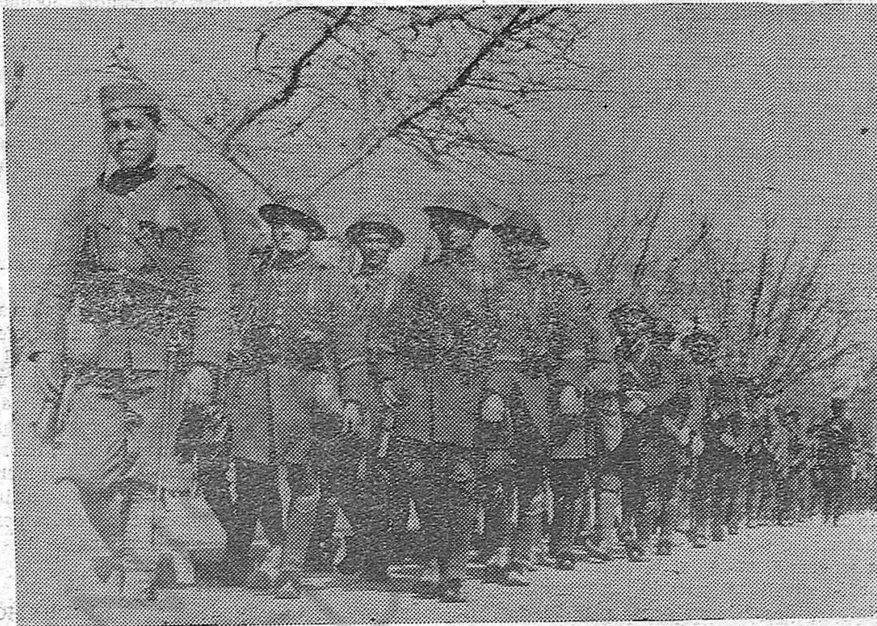
Como se sabe, las tropas gubernamentales han conseguido por fin adueñarse de Macedonia. He aquí el 12.º Cuerpo de Ejército en marcha hacia el teatro de operaciones.