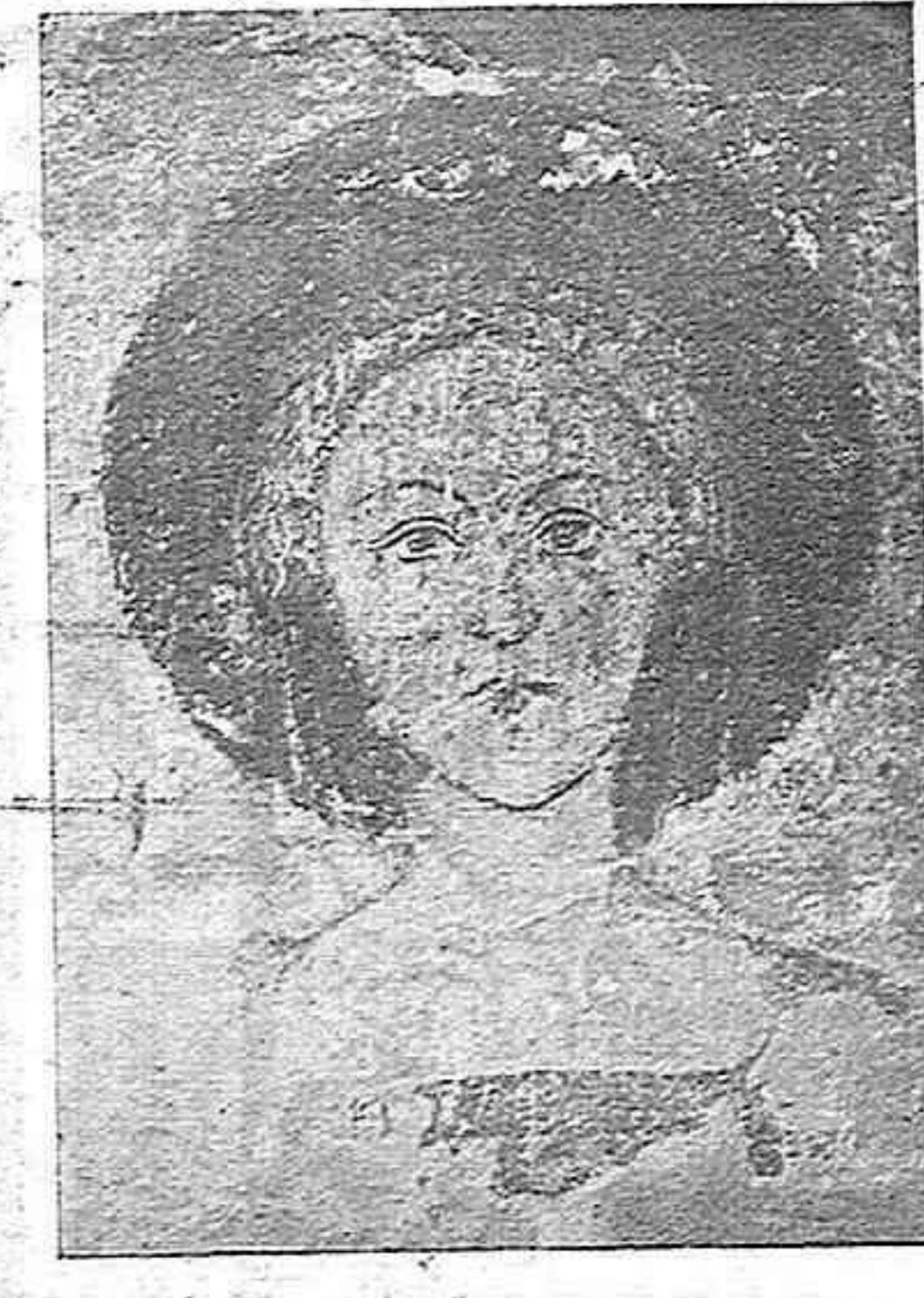
Figura 1 però la fesomia, emmarcada en oval perfectíssim, és tota una poe-

cantors. Dita figura, sembla que, per una compensació meravellosa que la Providència ens dongui, és troba magníficament conservada, i a més, és la més bella i fina de les descobertes fins ara. La oxidació de l'or del nimbe i de la corona floriditzada, no ens permet albirar prou els detalls d'ornamentació;