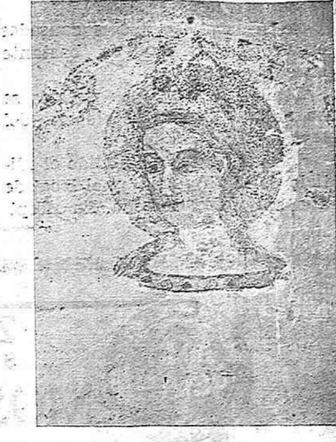
Figura 2 mar-se del poc que s'ha descobert fins ara, en diverses franges decoratives i en busts de Verges, alternant amb les estàtues (fig. 2). Ara bé aquestes pintures del baptisteri són evidentment posteriors que l'ur estil, a les de la capella de Santa Llúcia i de Nostra Dona de Montserrat (cosa senzillament comi provable, em diuen, i per tant datant les pintures aquelles de per llà el 1340, aquestes deuen datar

Em refereixo a les pintures de la capella del baptisteri, bastida i decorada ricament amb escultures i pintures per l'arquebisbe Cescomes, traspassat a l'any 1345. La decoració pictòrica d'aquest baptisteri, consisteix, segons pot vesllu-