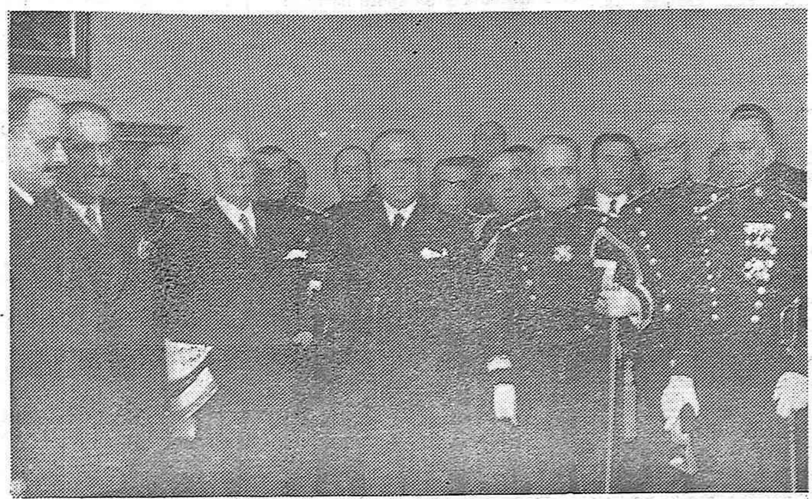
Ha sido concedida la corbata de la orden de la República a la bandera de la Guardia civil. Los jefes de la Guardia civil con los Sres. Lerroux, Rocha y otros ministros y personalidades durante la entrega del decreto.