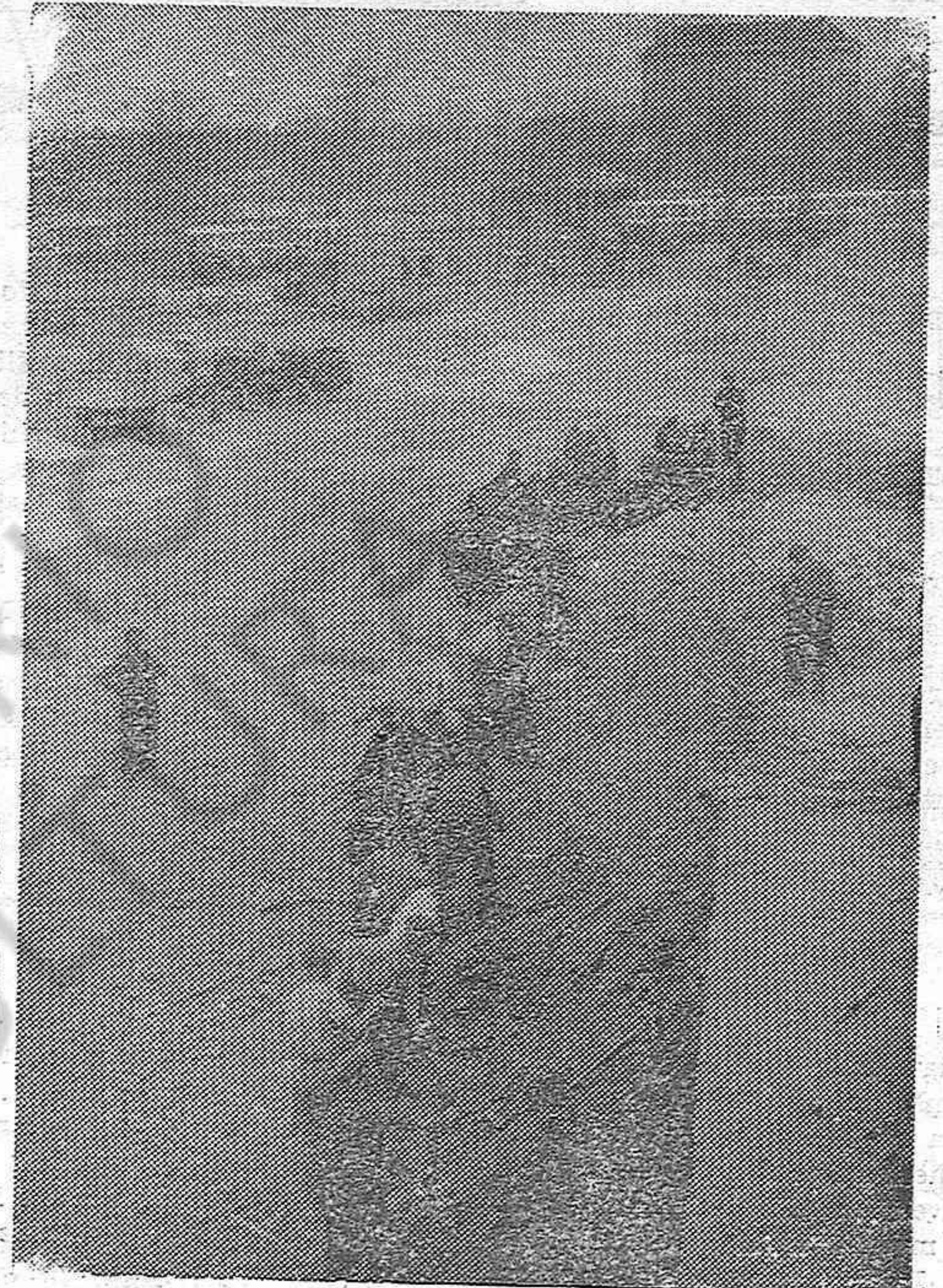
Los últimos vestigios de las fortificaciones parisienses son demolidos activamente en la Porte de Clichy.