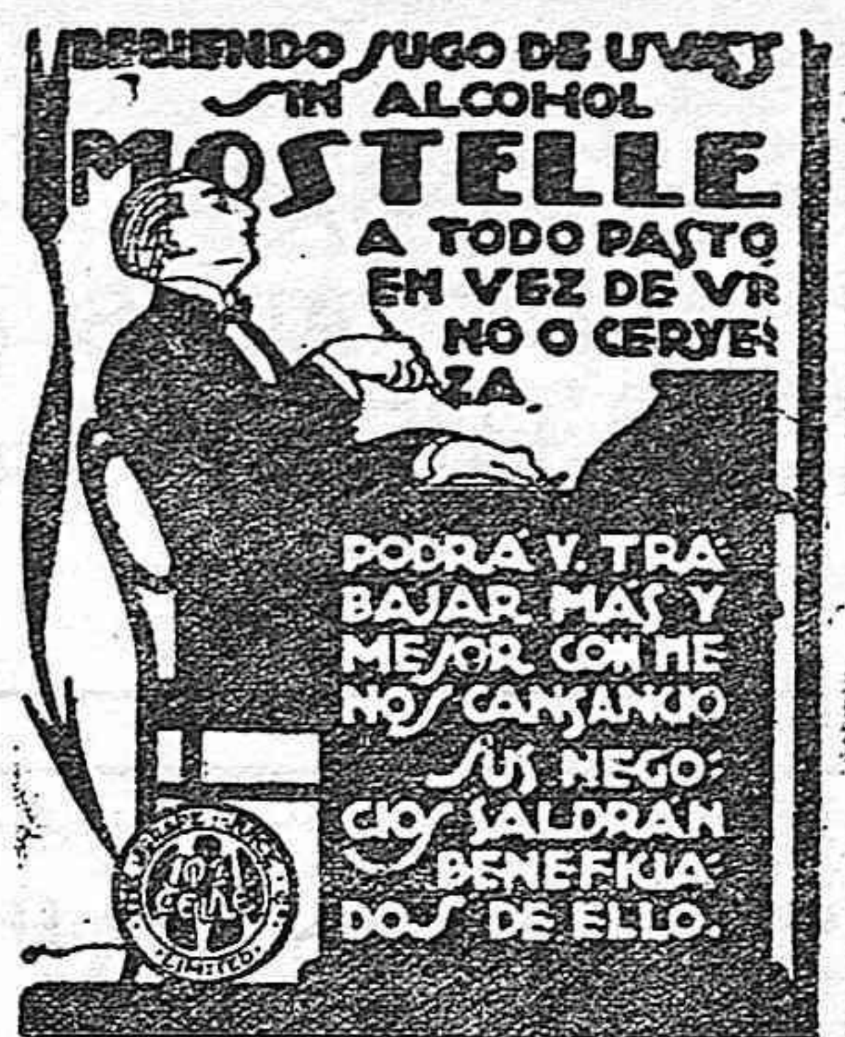
RAFAEL ESCOFET. — Tarragona