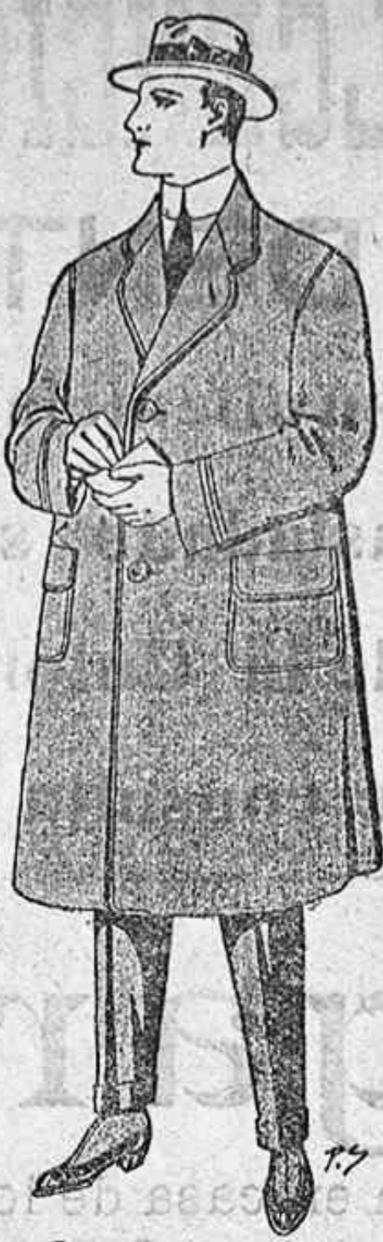
FIJESE V. EN LOS PRECIOS GABAN CABALLERO Clase extra 1.ª 35 » 2.ª 27,50 » 3.ª 20 » 4.ª 15 » 5.ª 10 » 6.ª 5 » 7.ª 2,50

A los que no envíen ni siquiera los quince céntimos se les dejará de enviar la Revista, entendiéndose que no la leen o que no quieren recibirla.