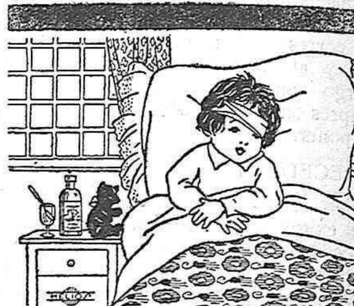
Manolito está en cama. ¿Qué tendrá Manolito?