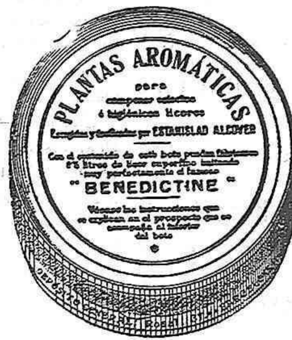
Facsimil del bote

Para la preparación, con el sólo concurso de vegetales de SELECTOS E HIGIENICOS LICORES similares a las más acreditadas marcas.