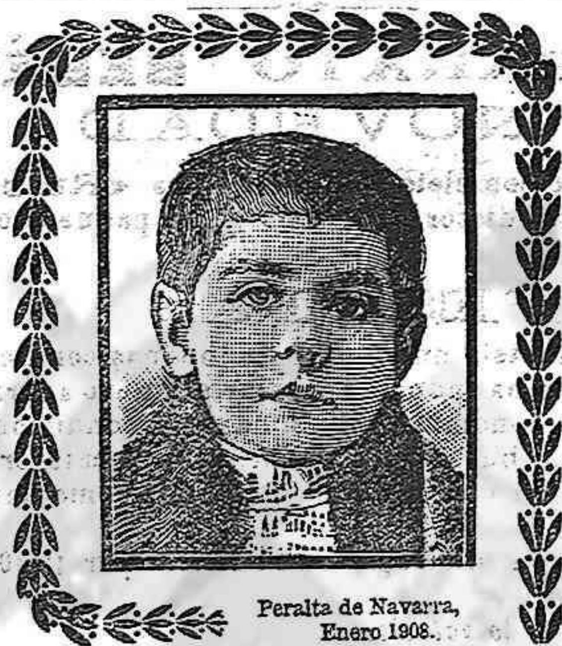
Peralita de Navarra. Enero 1908.

Recomendamos eficazmente el anun- cio «Escuela de Comercio».