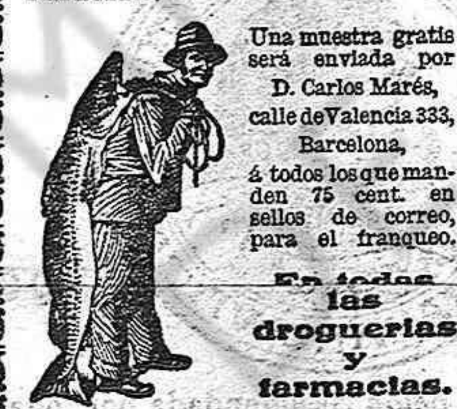
El Pescador y el Pescado

3. La Emulsión SCOTT es la única emulsión autorizada para llevar sobre el paquete la marca del "pescador y el pescado" ó sea la marca que garantiza una curación.