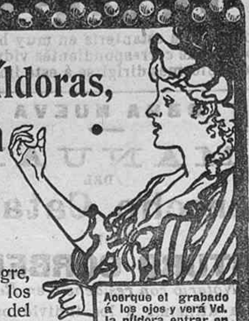
Ahorre el grabado a los ojos y verá Vd. la píldora entrar en la boca.