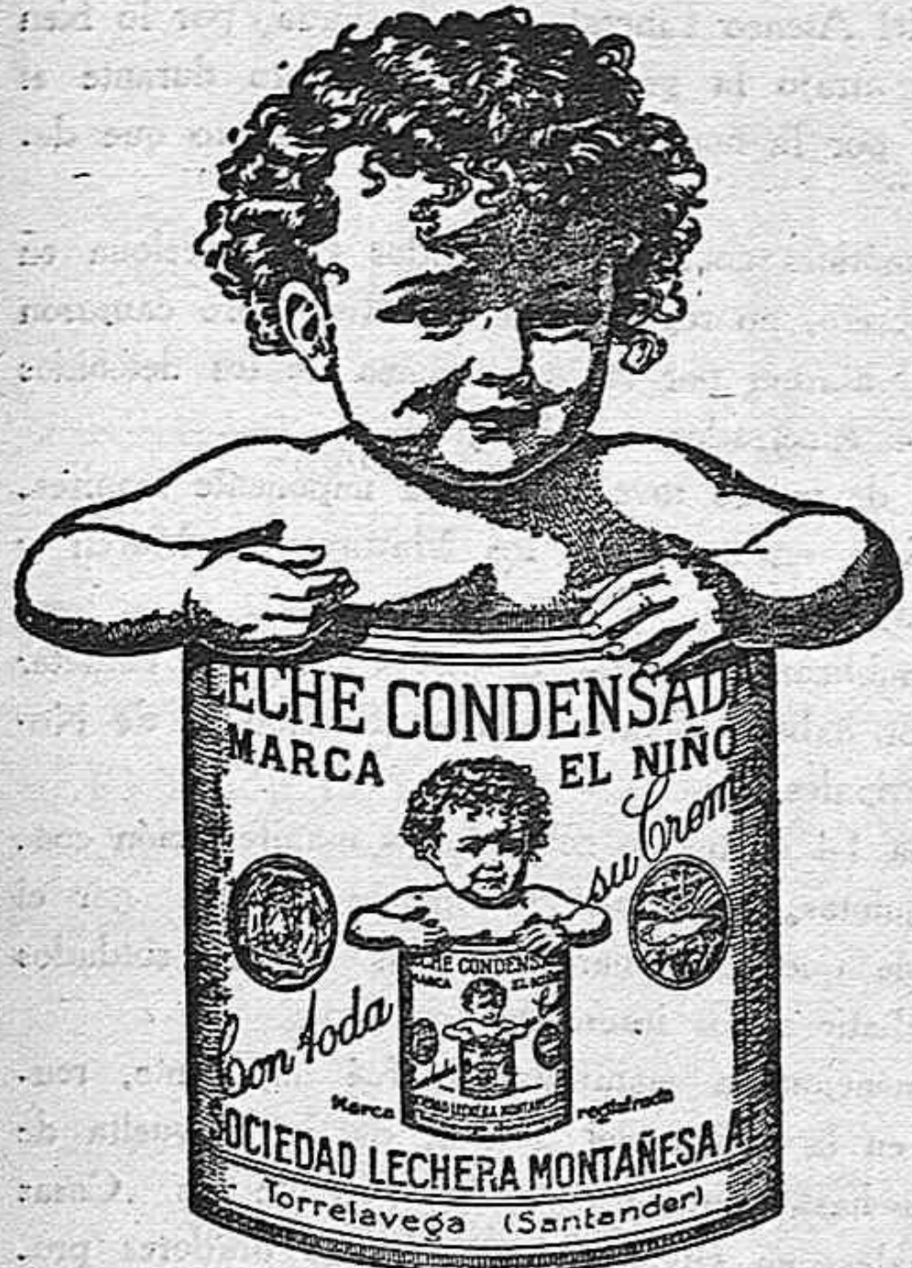
Diploma de Honor y Medalla de Oro en la Exposición Agrícola de Barcelona, de 1927.

Capital: 10.000.000 de pesetas, ENTERAMENTE NACIONAL