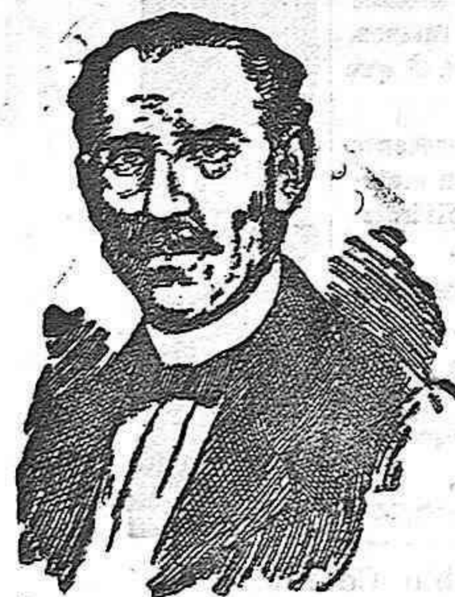
D. Modesto Lafuente Brevisimos datos biográficos

Nació en Rabanal de los Caballeros (Palencia) en 1.º de Mayo 1808 † En Madrid el 25 de Octubre de 1866.