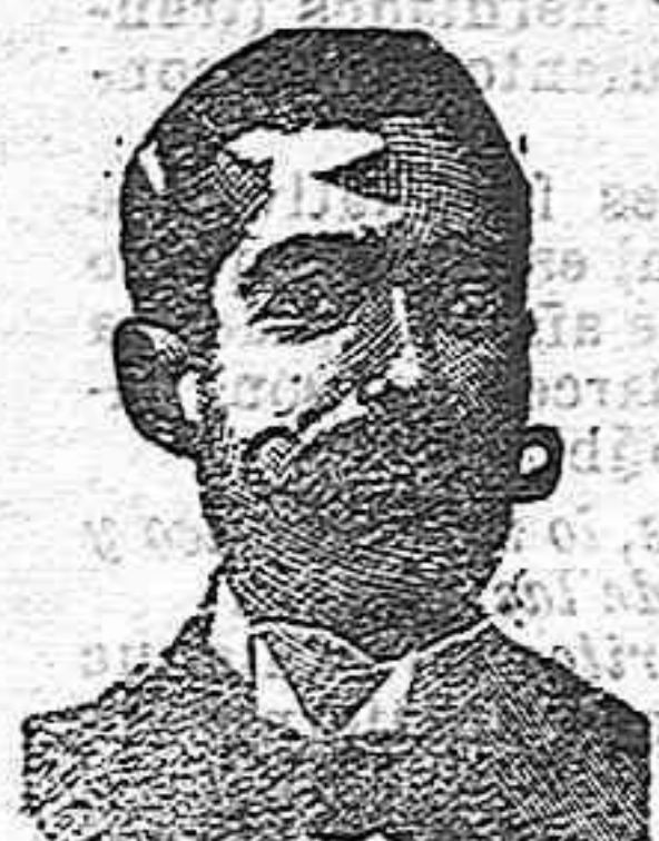
Inventor de los renombrados medicamentos COSTANZI