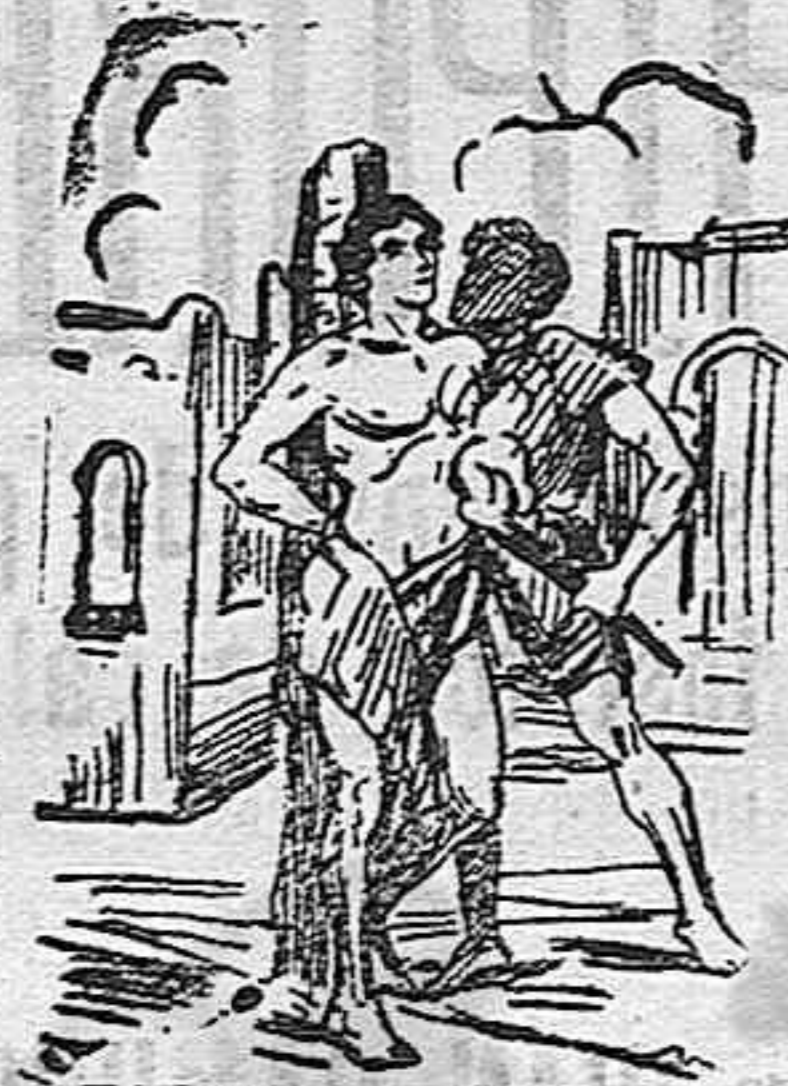
Martirologio. SAN GREGORIO.

San Gregorio. Ayuno con abstinencia de carne.