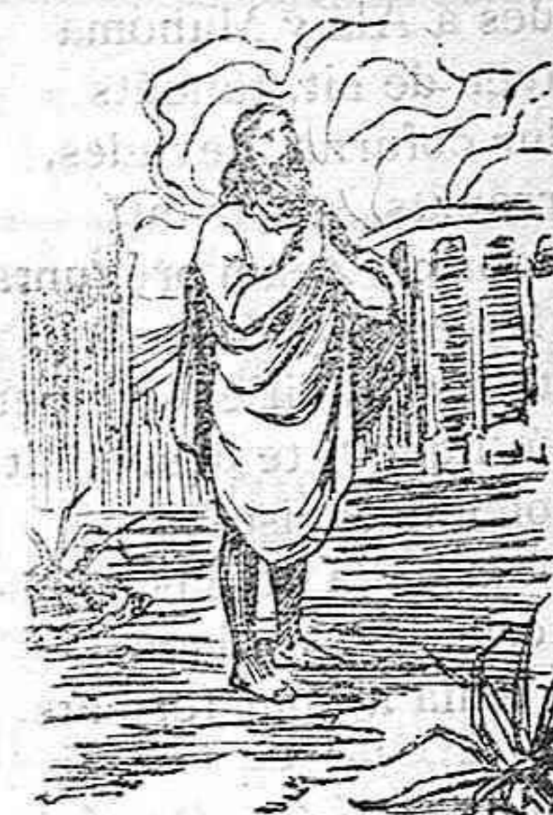
Martirologio: SAN FLAVIANO

Desempeñaba en Roma, á principios del siglo IV, los principales cargos de la magistratura. Como su celo por la religión era tan grande, no perdonaba medio para extenderla por doquiera. Esto le atrajo el odio de la corte y fué destituido de sus empleos, empezando para él una vida de privaciones y miserias. Fué degradado de su nobleza; marcado en la frente con un hierro candente, y, aun cuando no se atrevieron á quitarle la vida por temor a una sedición, se le hizo morir á fuerza de privaciones.