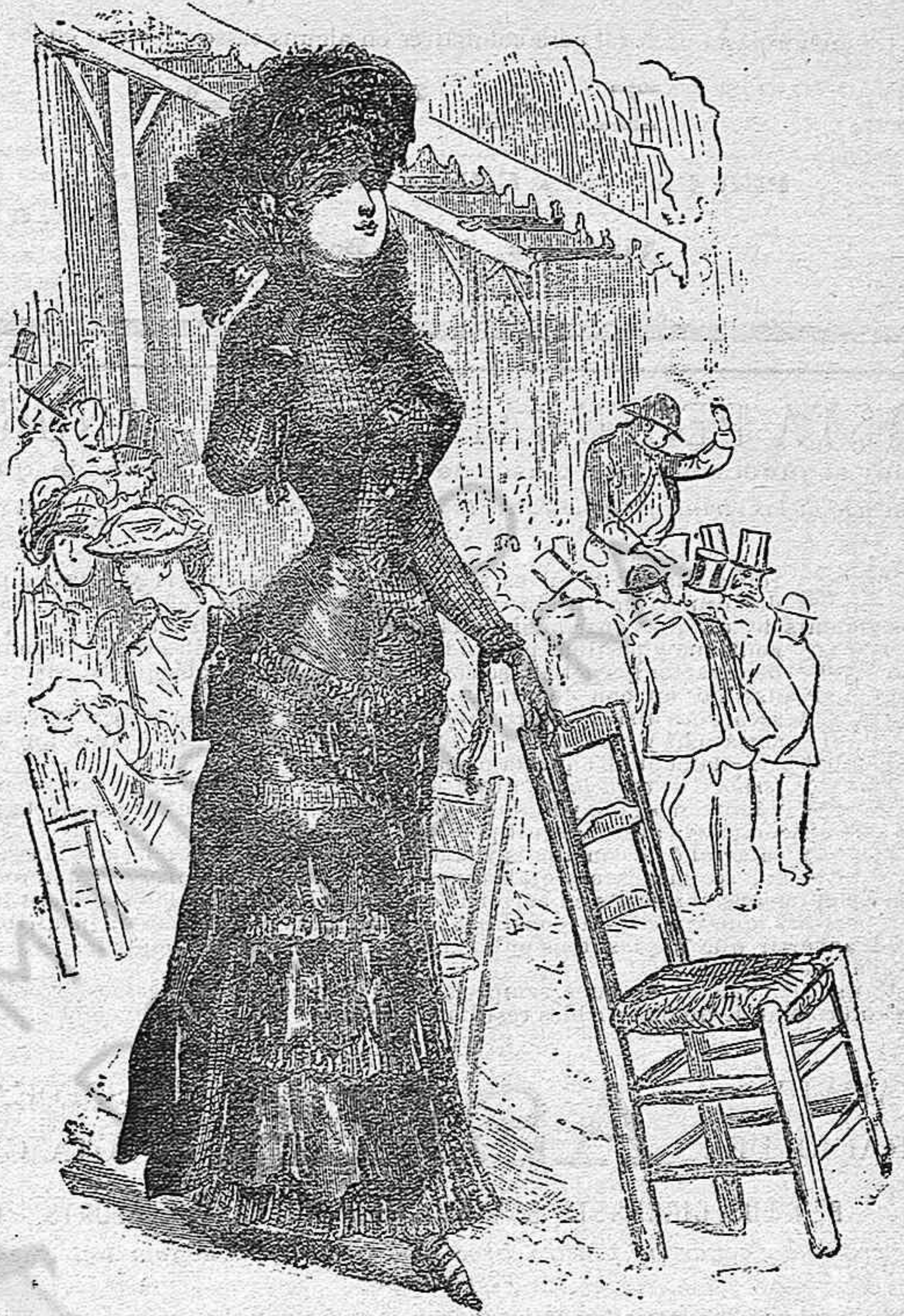
Vestit d' espectacles al aire lliure.

doblar ó no doblar, segons la conveniencia. —Sombrero en satí negre carregat de plumas ab banda de franjas d' azabatxe. Lo llas en punta negra y azabatxe.—Bano de plumas d' azabatxe.