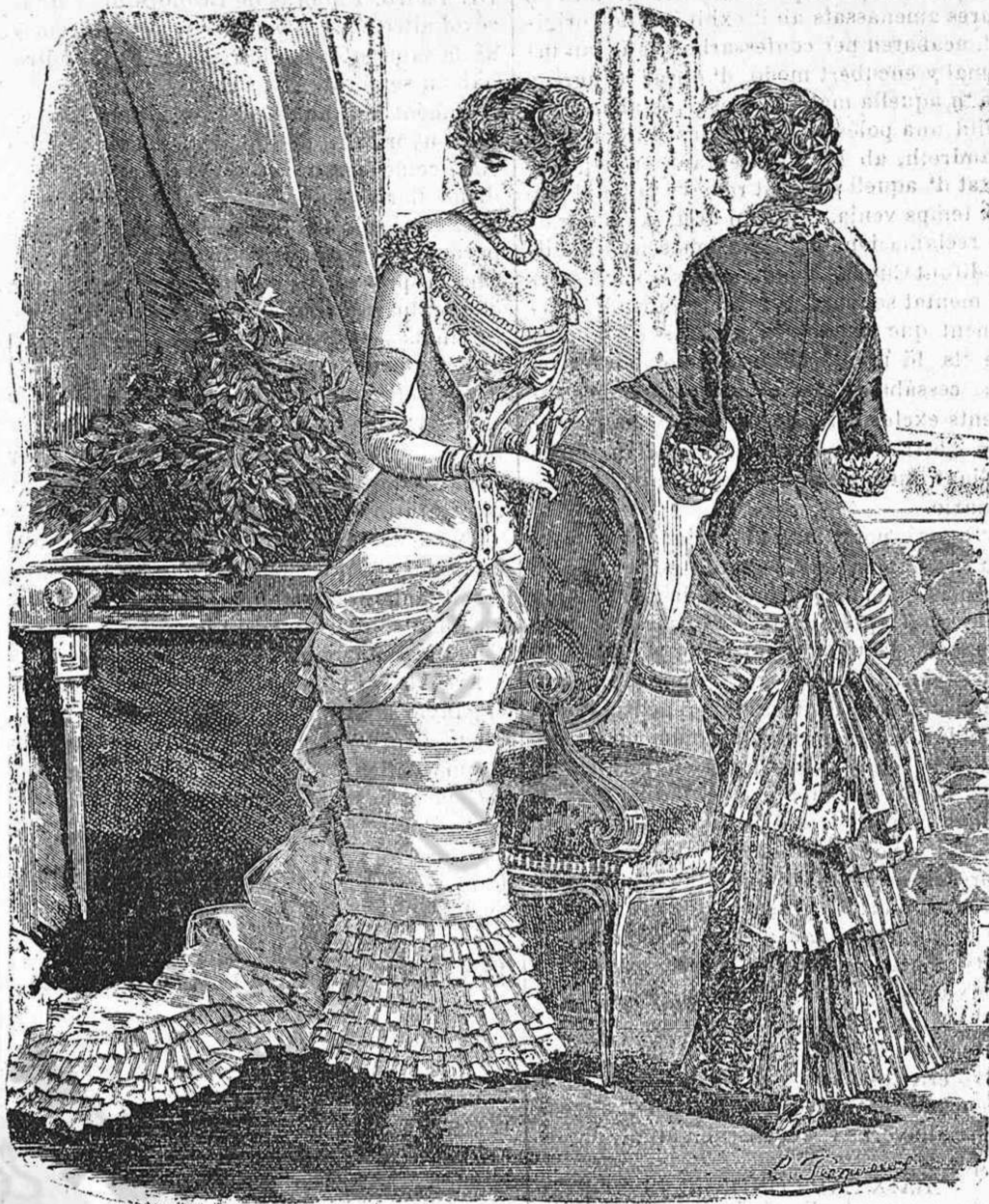
Trajos per gran dinar.