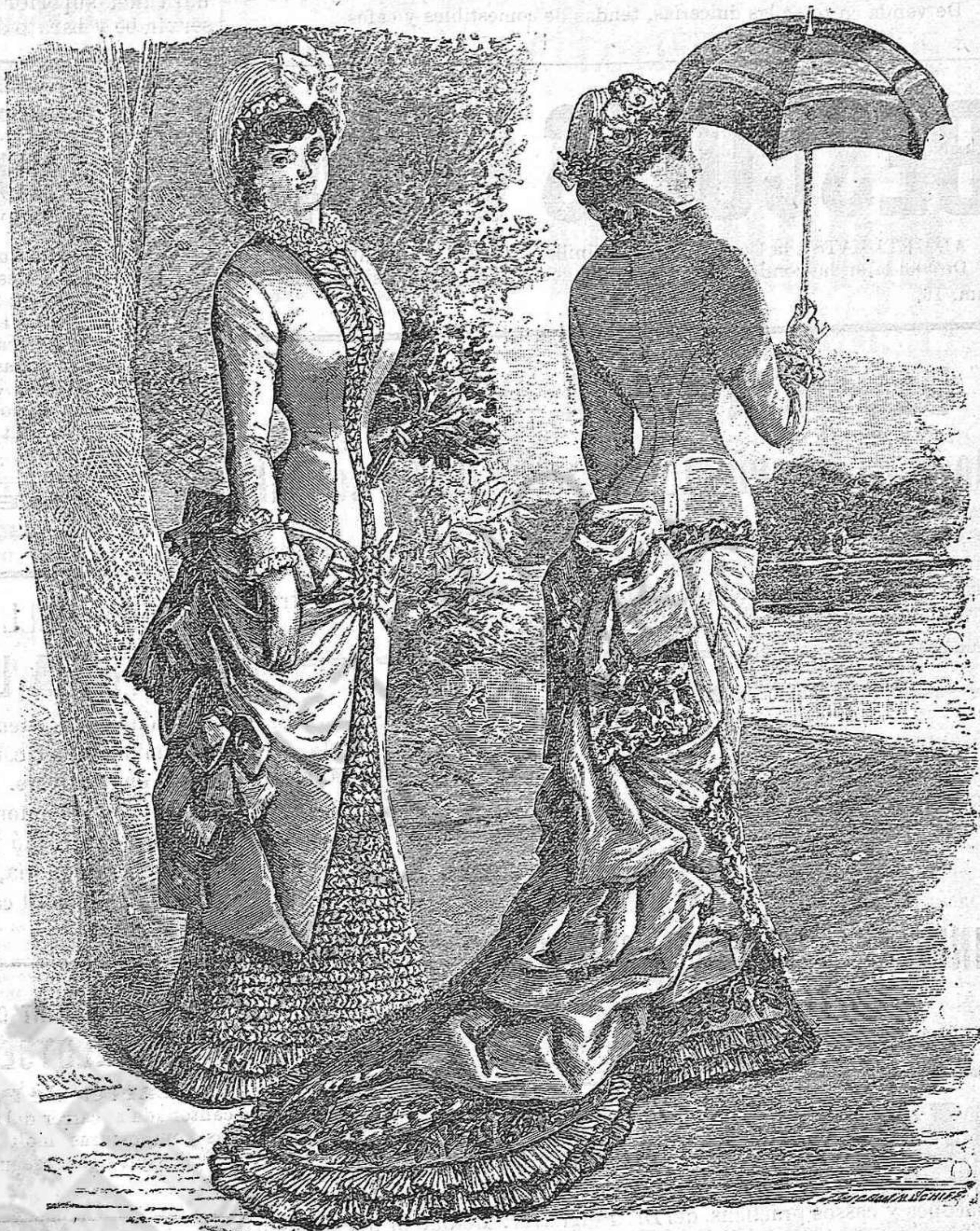
Vestits de Camp.