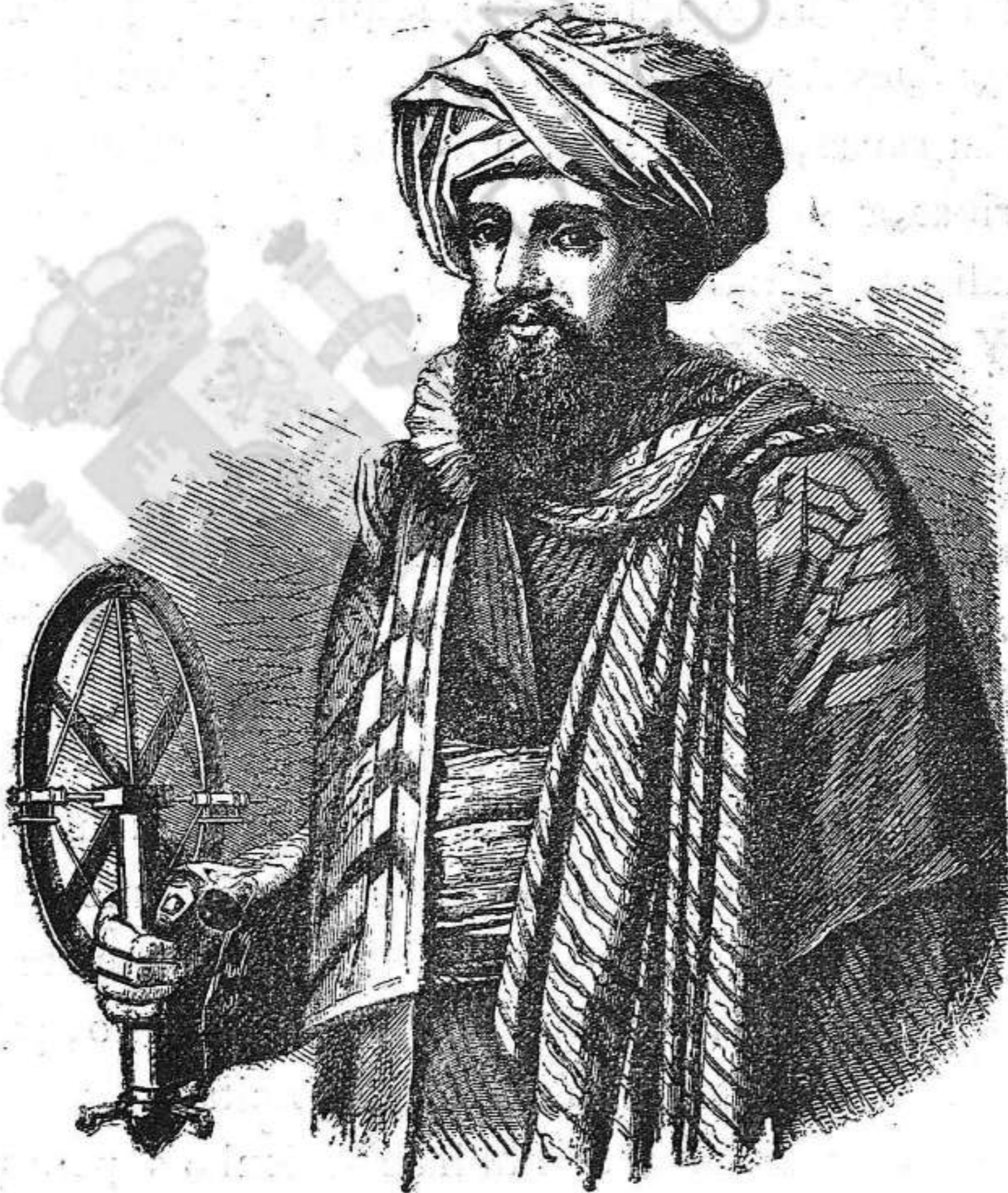
Ali-Bey lo Abbassi. (Domingo Badía Leblich.)