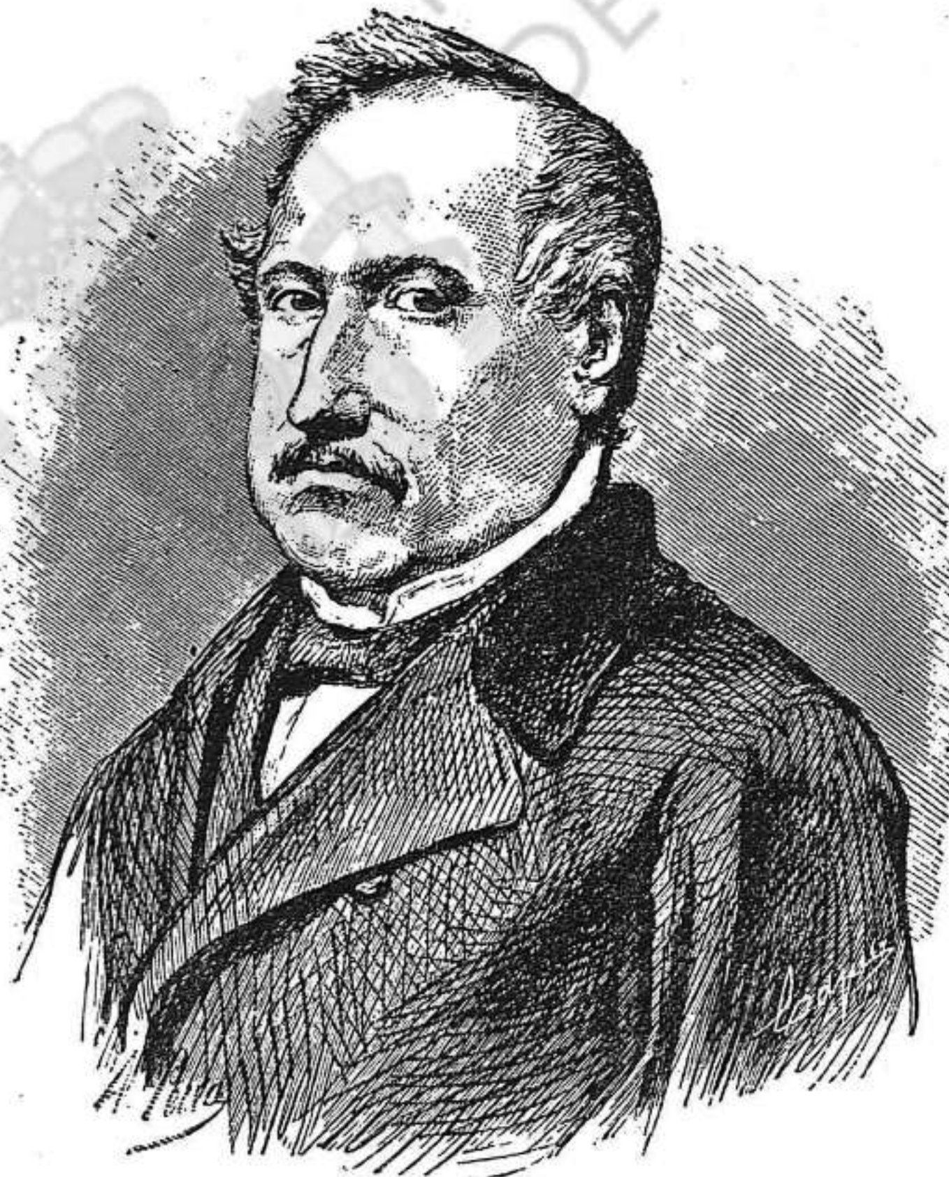
CARLES BONAVENTURA ARIBAU

Carrer de la Cucurulla, número 3 Llibreria