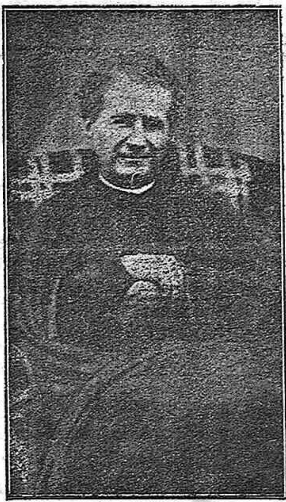
Beato Juan Bosco, Fundador de la Congregación Salesiana y del Instituto de Hijas de María Auxiliadora

Hoy la alegría nos invade, la emoción nos embarga; nuestro maestro, el padre y educador de nuestras almas, a la voz del Supremo Jerarca de la Iglesia, es colocado entre el núme-