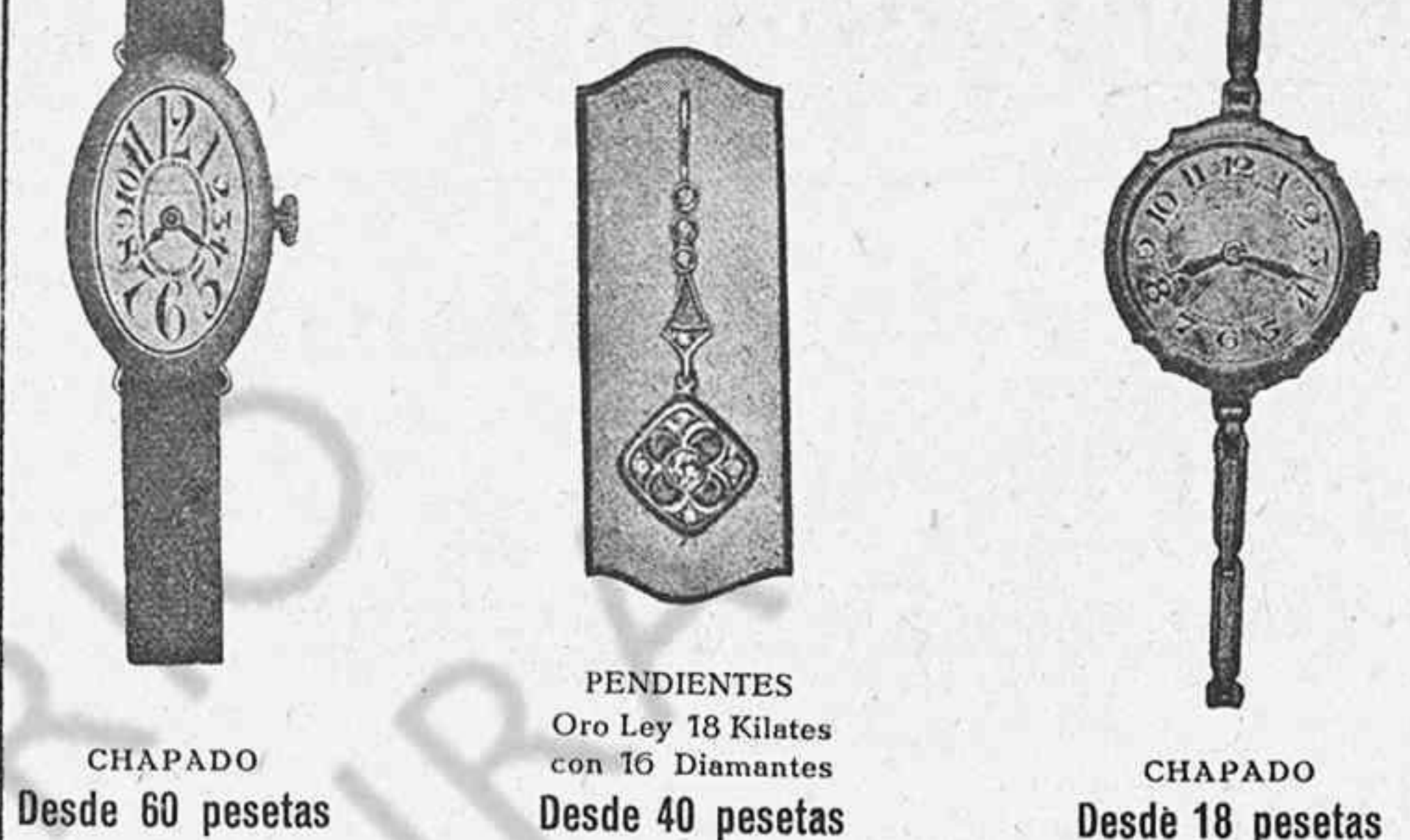
CHAPADO Desde 60 pesetas

Unica casa que cuenta con taller para toda clase de composuras en joyas, relojes, gramófonos y óptica; se hacen toda clase de recetas de los señores oculistas.