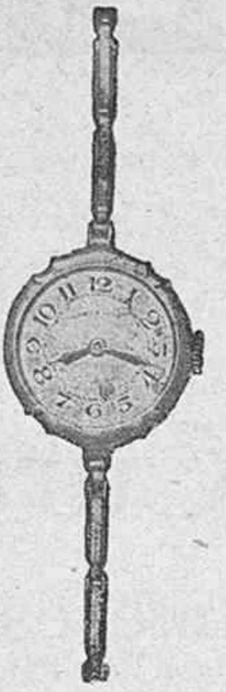
CHAPADO 18 PESETAS