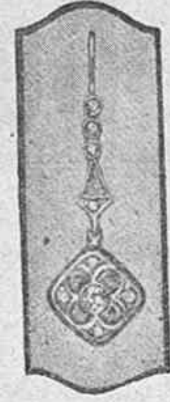
Oro Ley 18 Kilates 16 Diamantes 40 PESETAS