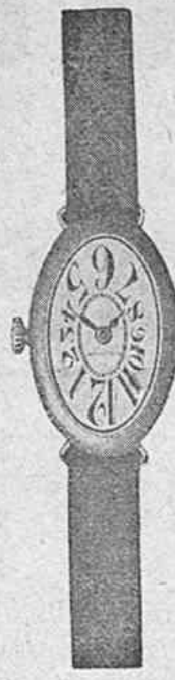
CHAPADO 60 PESETAS

Unica casa que cuenta con taller para toda clase de composturas en joyas, relojes, gramófonos y óptica; se hacen toda clase de recetas de los señores oculistas.