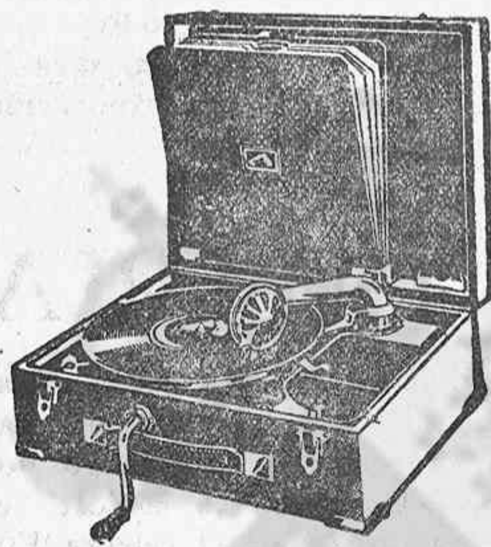
GRAMOLA, 210 ptas.

Relojes pared y bolsillo a precios muy baratos