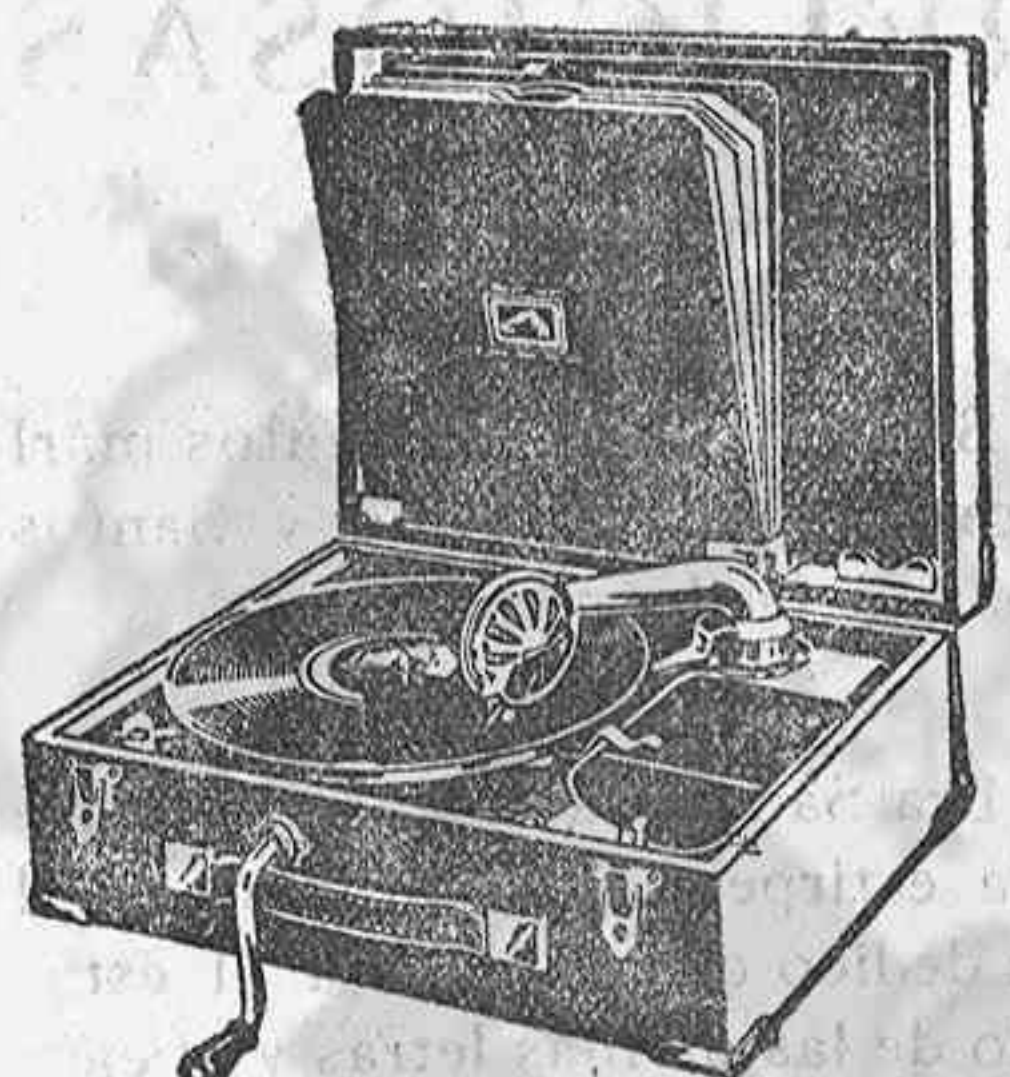
GRAMOLA, 210 ptas.

hay establecidos precios económicos a base de marcas de reconocido nombre