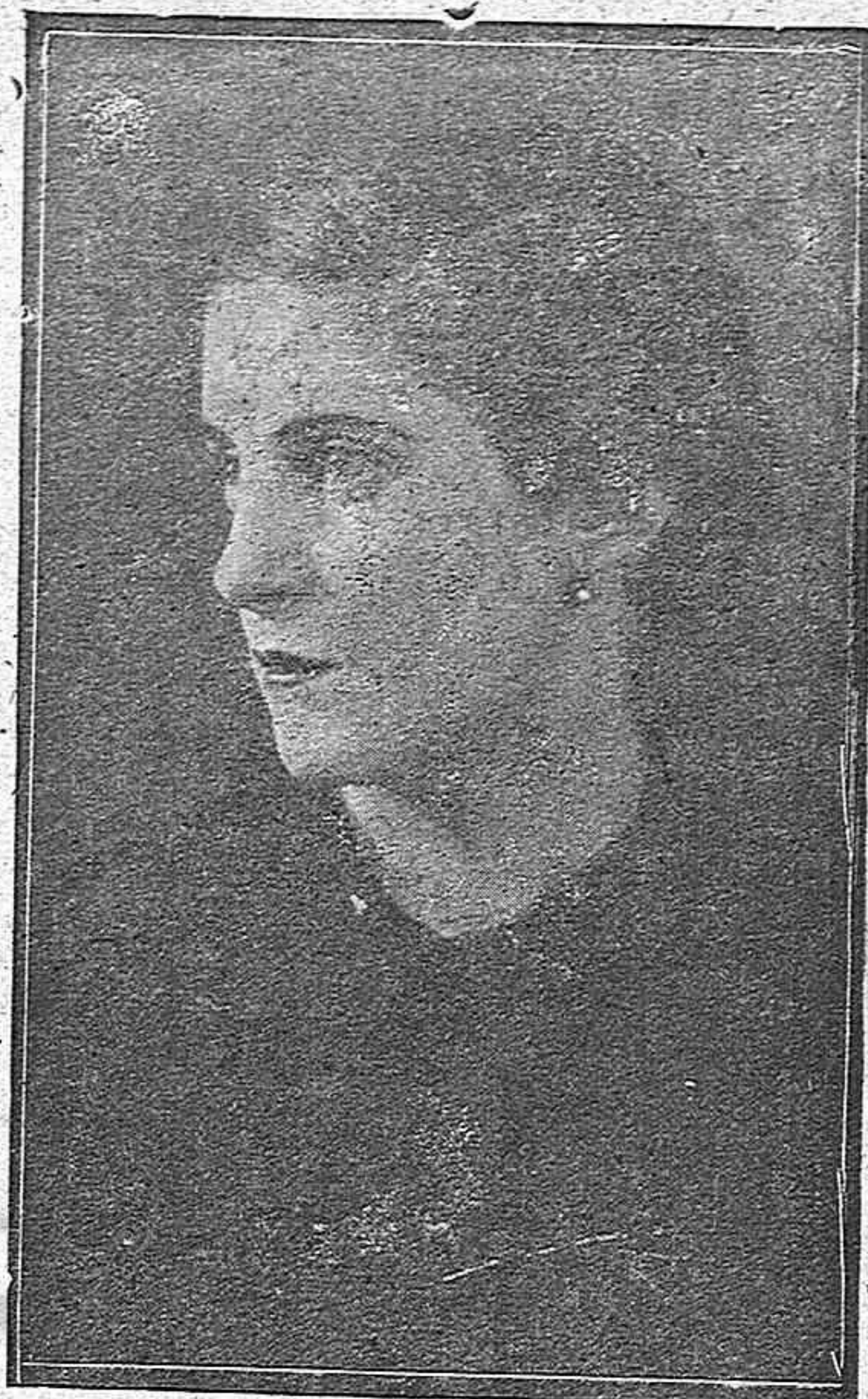
PILAR PRIMO DE RIVERA

PILAR PRIMO DE RIVERA LLEGARA HOY A NUESTRA CIUDAD