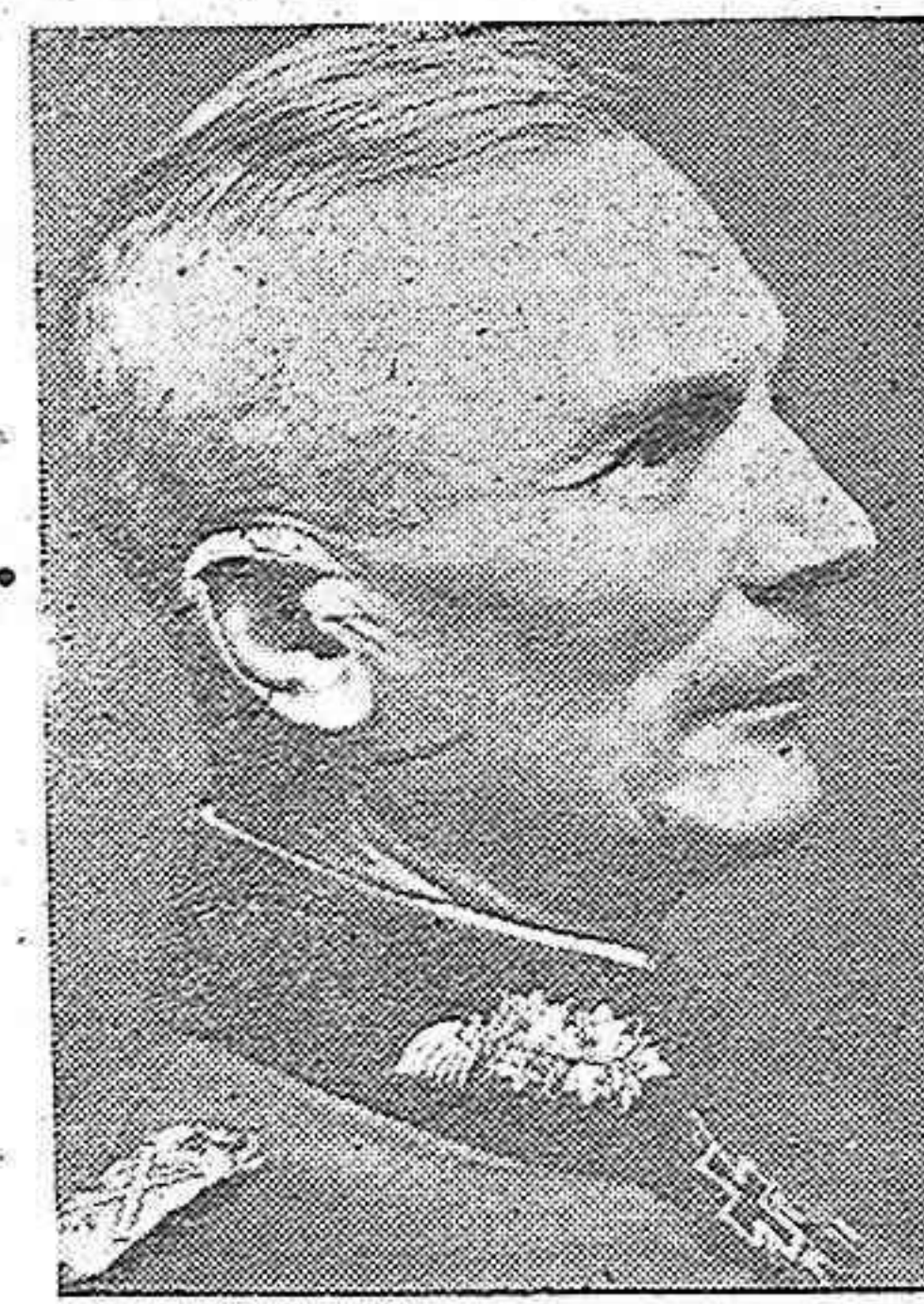
FIGURAS DE LA GUERRA

Estocolmo, 18.—Toda Suecia se halla profundamente conmovida por