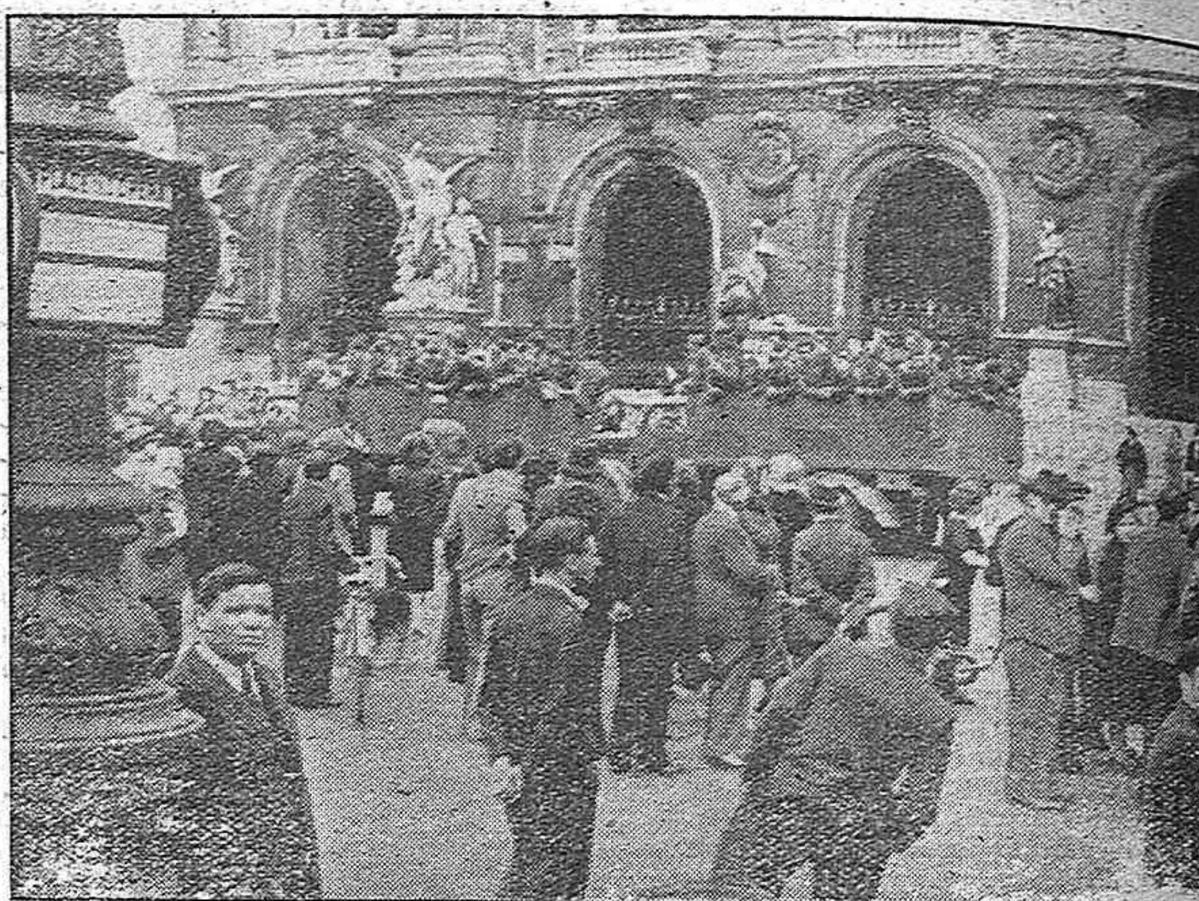
La población parisina viendo pasar largas columnas del ejército derrotado