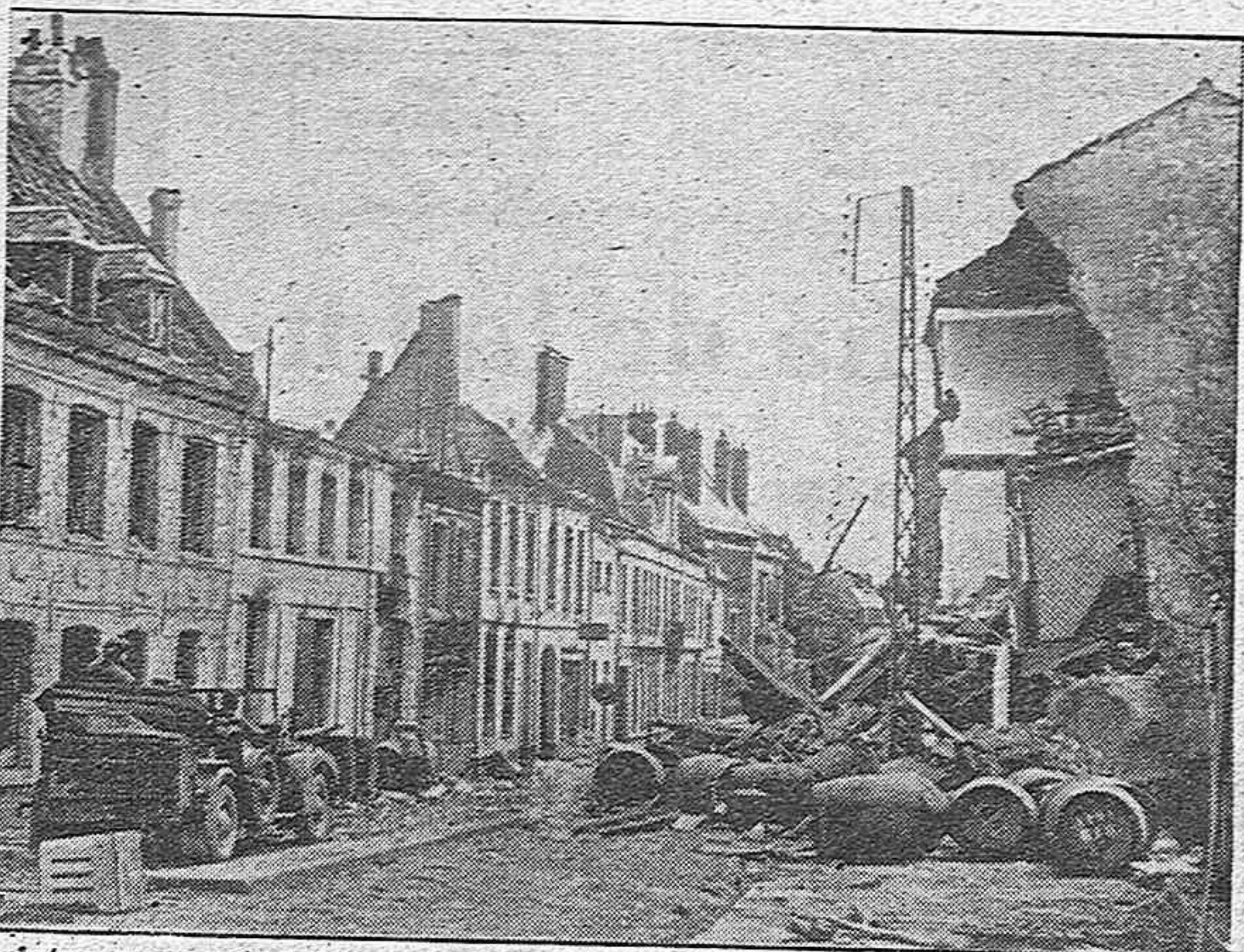
Tristes recuerdos de una alianza fatal que se encuentran en centenares de ciudades francesas. La labor de reconstrucción ha empezado ya con el ímpetu peculiar del espíritu teutónico