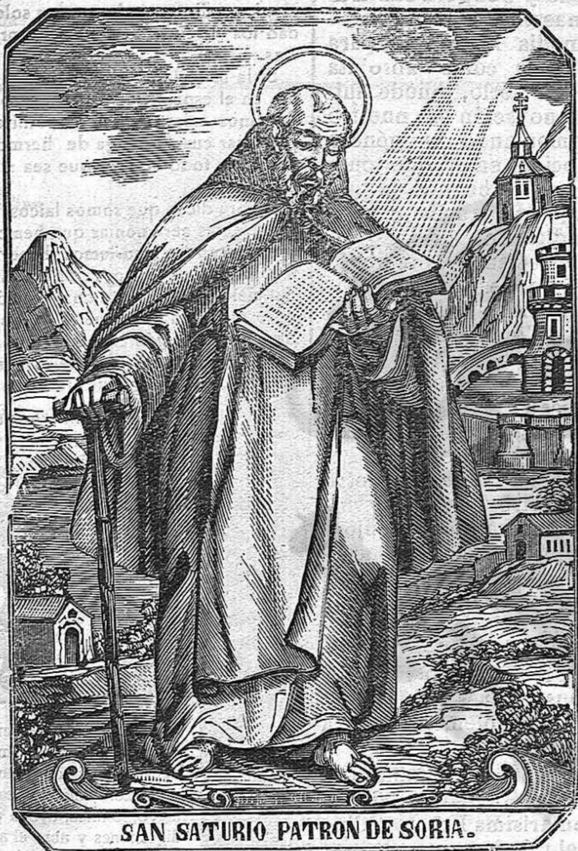
SAN SATURIO PATRON DE SORIA.

Muerto San Saturio el día sexto de las nonas de Octubre en la era 606 (2 de Octubre del 568) y cumpliendo Prudencio los mandatos de su santo maestro, depositó los restos en la ermita ó oratorio que al Arcángel San Miguel tenía dedicado saturio, no en la misma cueva ó nicho de ella que le sirviera de habitación para su vida, como equivocadamente dijo un historiador, confundiendo sin duda la cueva con el oratorio, siendo así que la dicha cueva y oratorio, fueron dos sitios diversos a un que no distante uno de otro, como lo confirman auténticos documentos; «e vestigia castri, oratorium in rupis immanis forá-