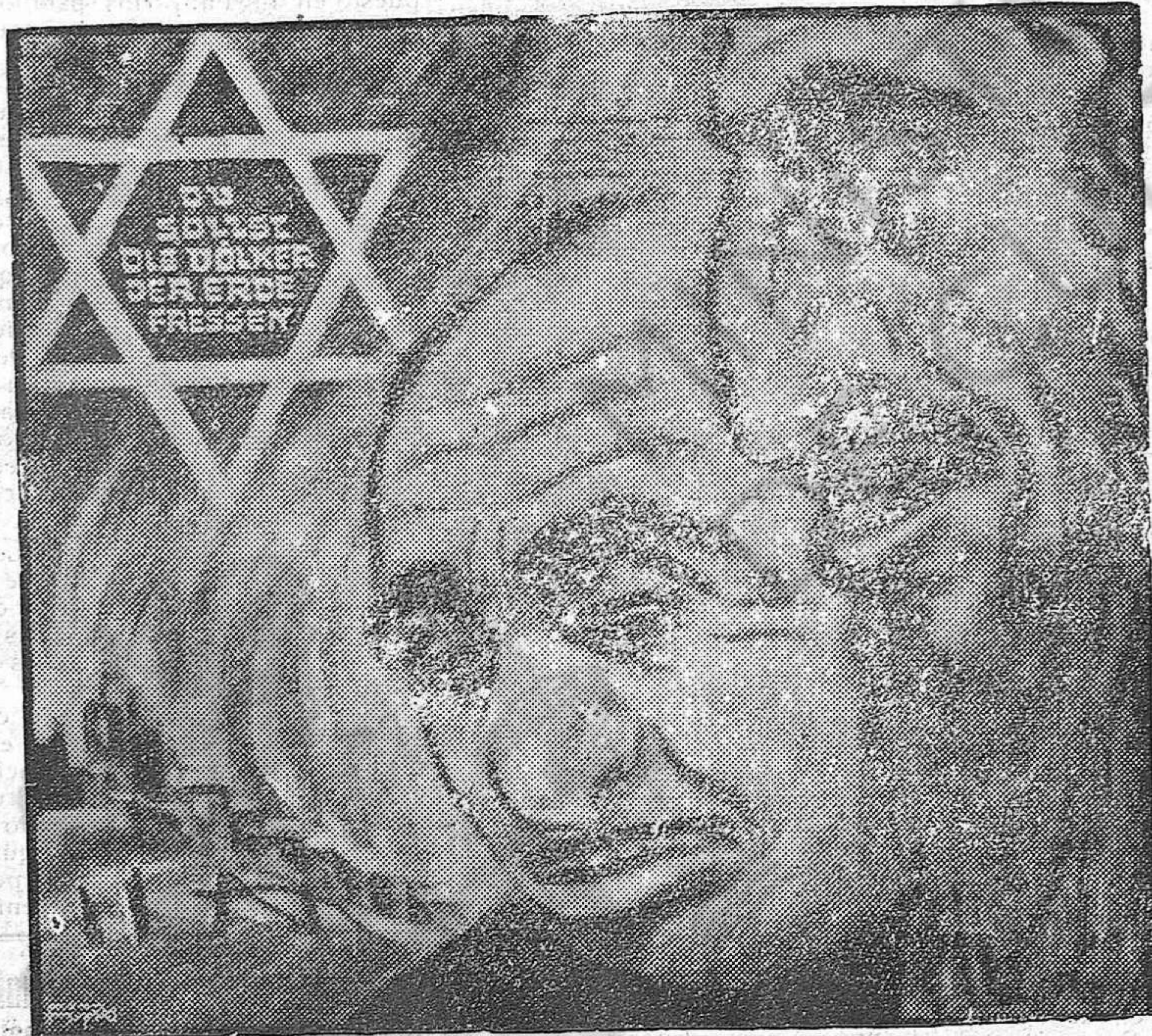
«Todas las tierras del mundo para nosotros», dice el lema semita. Y a la vista de nuestros pueblos — ejemplo ante el mundo de Catolicidad y fortaleza — incendiados, se avivan sus ojos y su sonrisa contra la repugnante monstruosidad de su codicia enervada