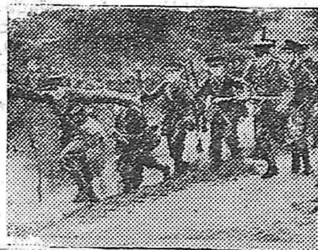
Los escolares de Eton y Harroy cumplen en Aldershot su instrucción militar.