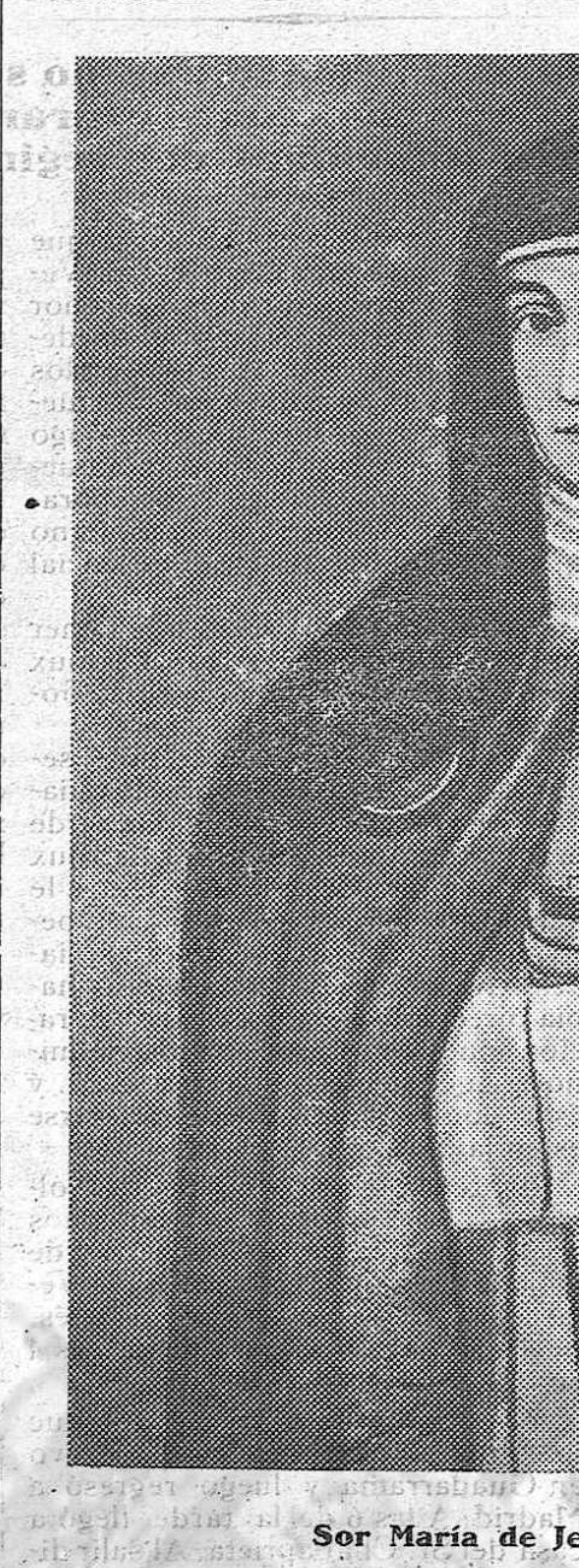
Sor María de Jesús de Agreda