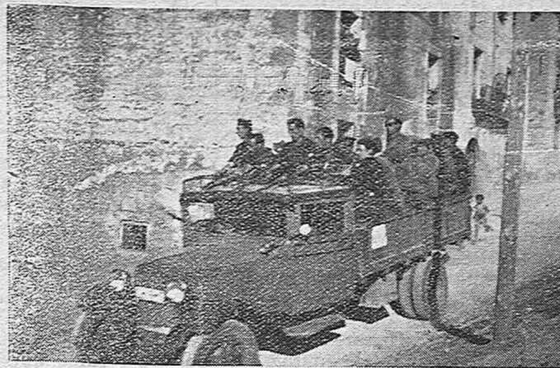
En las calles de Soria se ven a menudo escenas como la presente en la que grupos desolados y milicias marchan en camiones hacia los frentes