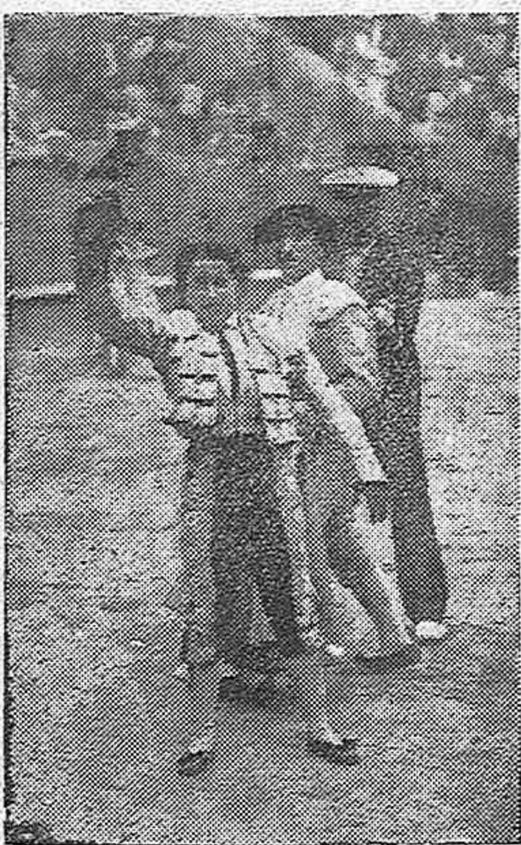
Dorita Gómez «La Gallito» que actuará en esta Plaza el próximo Domingo, matando dos novillos