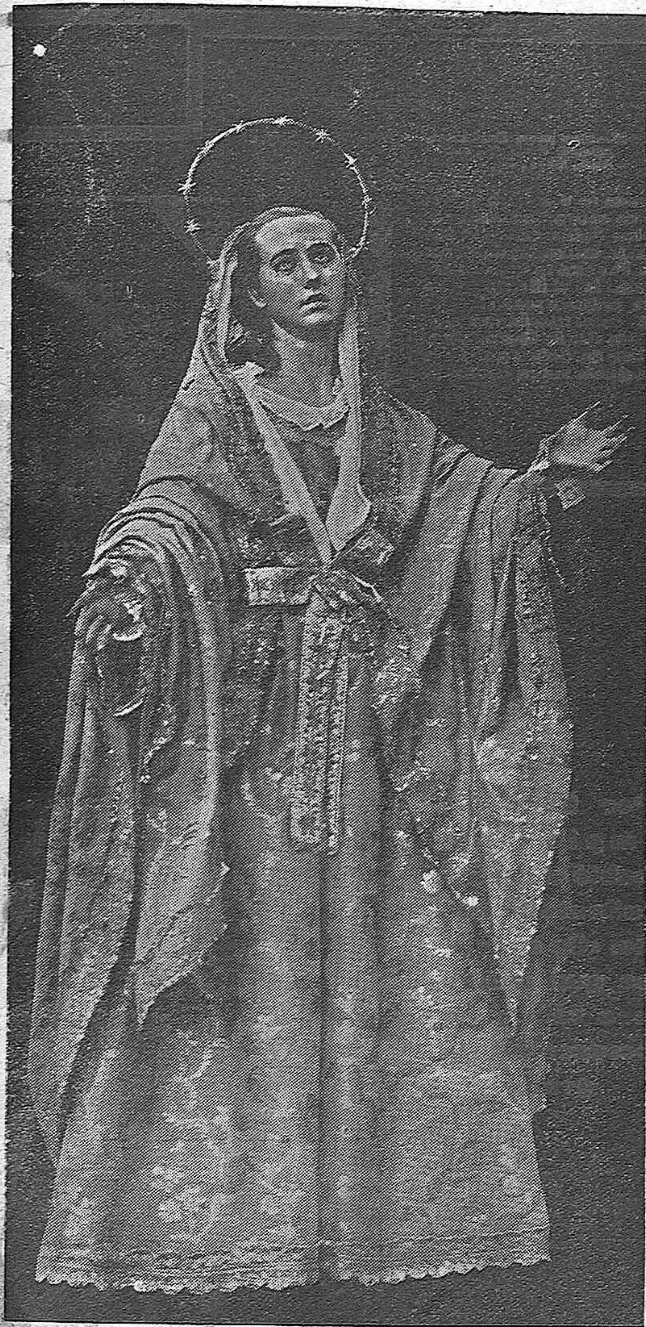
LA VIRGEN DOLOROSA