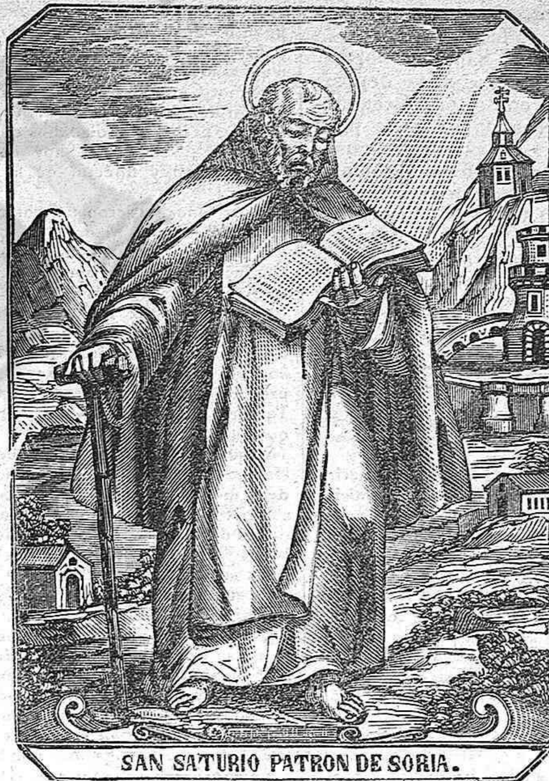
SAN SATURIO PATRON DE SORIA.