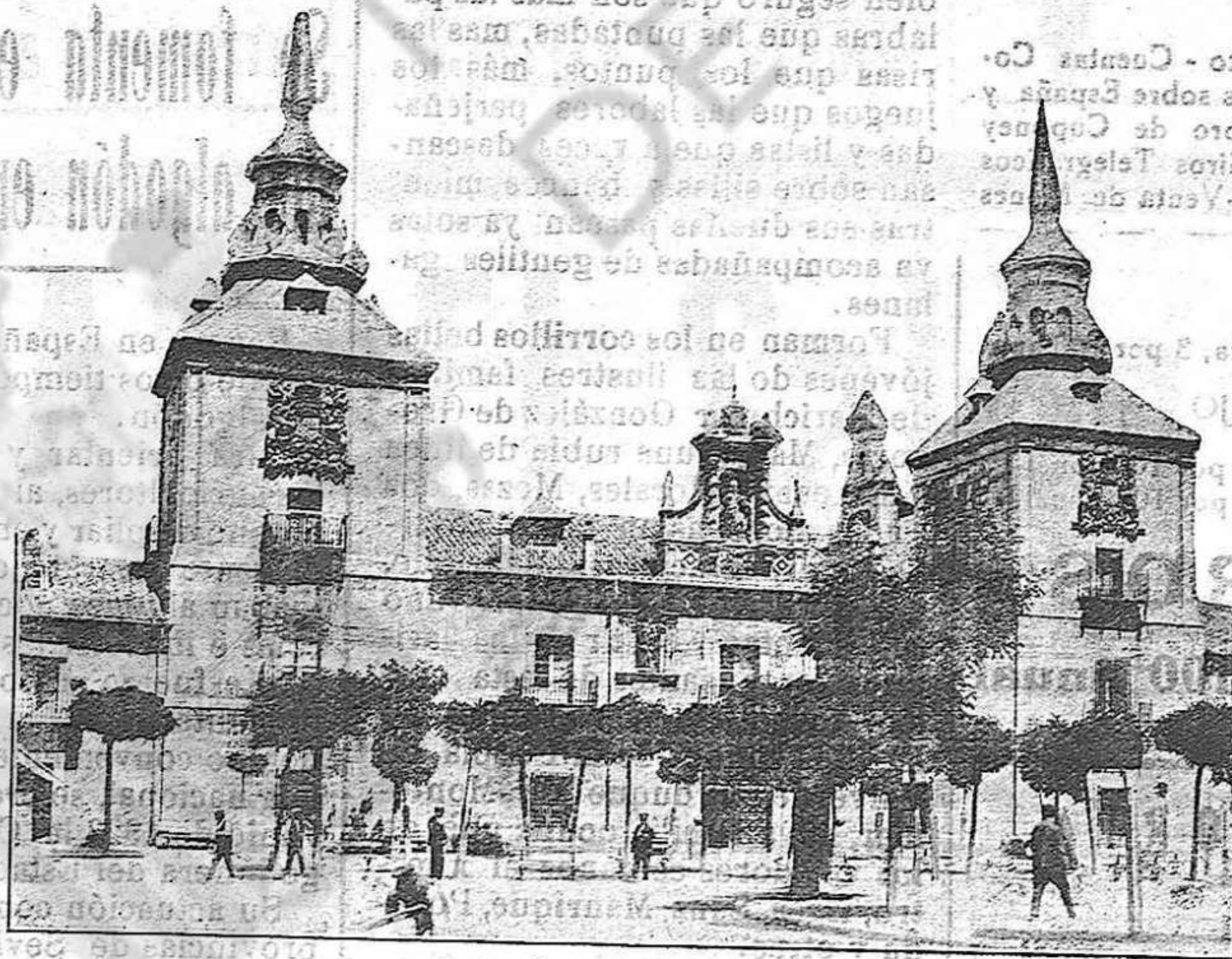
Nave central del Hospital de Burgo de Osma, incendiado parcialmente el pasado viernes