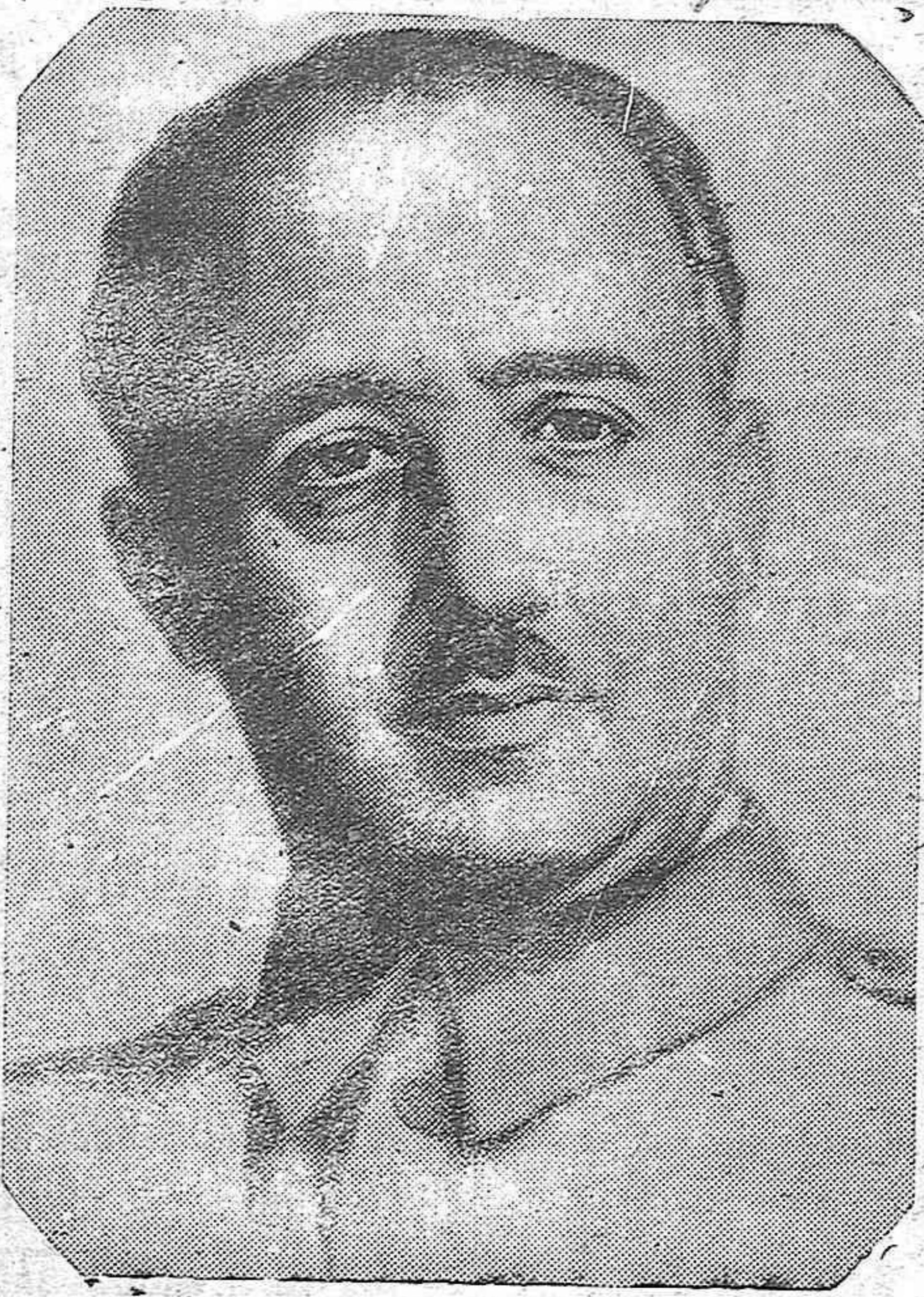
S. E. D. Francisco Franco Bahamonde, Jefe del Estado, Generalísimo de los Ejércitos de Tierra, Mar y Aire, Caudillo de la Revolución española y Jefe Nacional de Falange Española Tradicionalista y de las J. O. N. S. Primer vencedor del comunismo en el Mundo