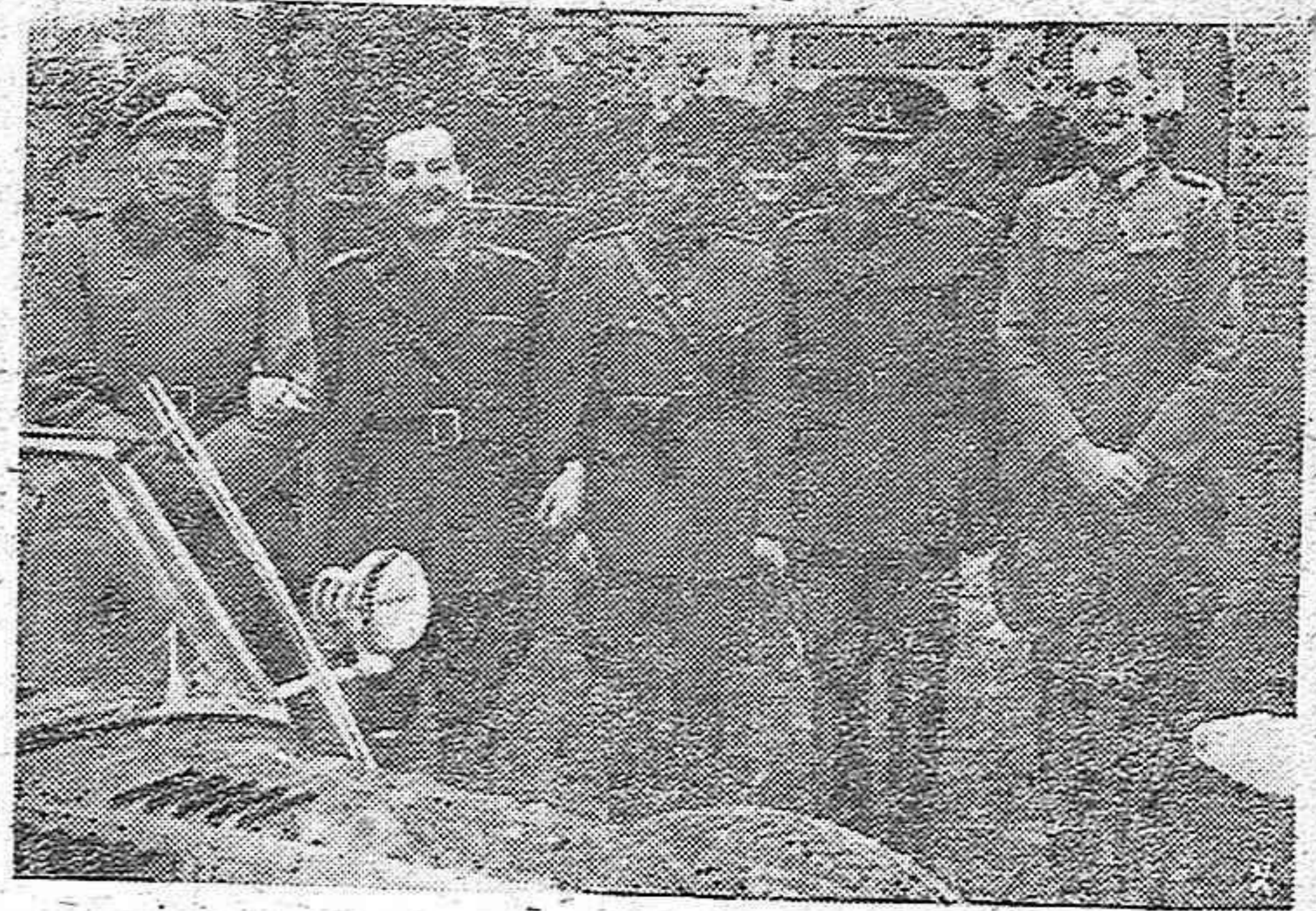
Un grupo de oficiales alemanes, rumanos y húngaros, acompañando a un general alemán que visita el sector bajo su mando, en el frente sur