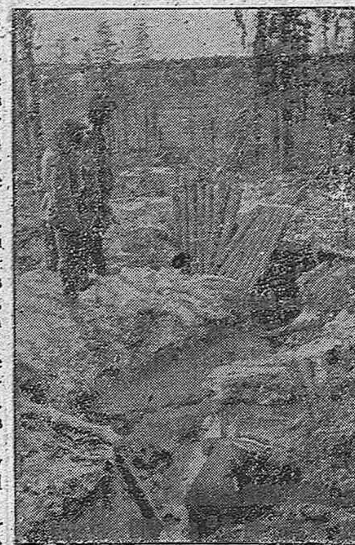
Trinchera tomada a los soviets en el frente norte

Fueron repartidos al público números de los periódicos del Campamento, «Mástil» y «Volante» publicados en número extraordinario con ocasión de la Clausura.