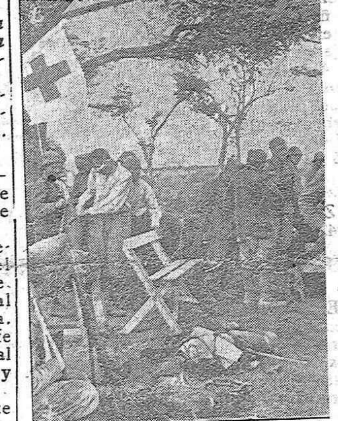
Directamente detrás de las líneas de combate ha sido instalado este puesto de la Cruz Roja rumano, donde reciben los heridos la primera cura, y donde se organizan su transporte a los lazaretos

En consecuencia, el enemigo ha sufrido uno de los desastres más graves de los que les han sido infligidos hasta ahora en operaciones contra convoyes. En seis días, el enemigo ha perdido 38 mercantes, cargados de materiales de guerra de (Continúa en la pag. 4.ª)