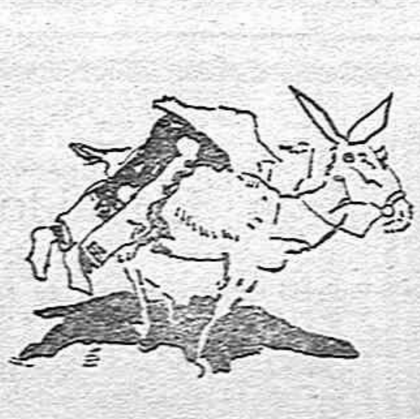
II.—El gitano, que tiene ciega confianza en sus amigos del cielo, pone tal fe en su empeño...