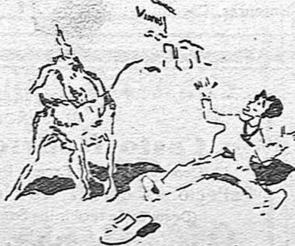
IV.—Y el gitano, indignado, recomienda a sus amigos celestiales. —¡Home, no tené malage; no empujar los tres a la vez!