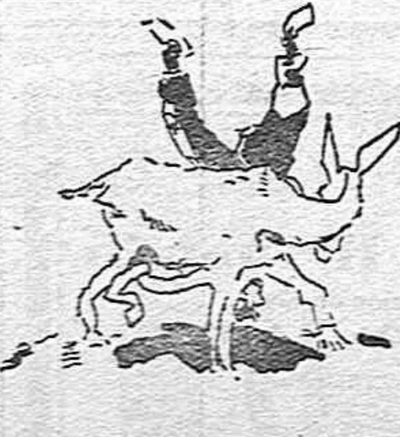
III.—...que se cae por el otro lado.