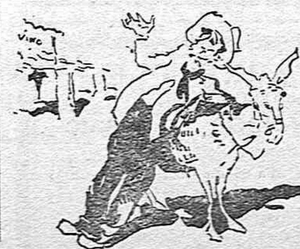
I.—El gitano, que ha bebido más de la cuenta, trata de subirse en su burro sin conseguirlo, pero se acuerda de que allá, en el cielo, tiene unos amigos y les pide ayuda.