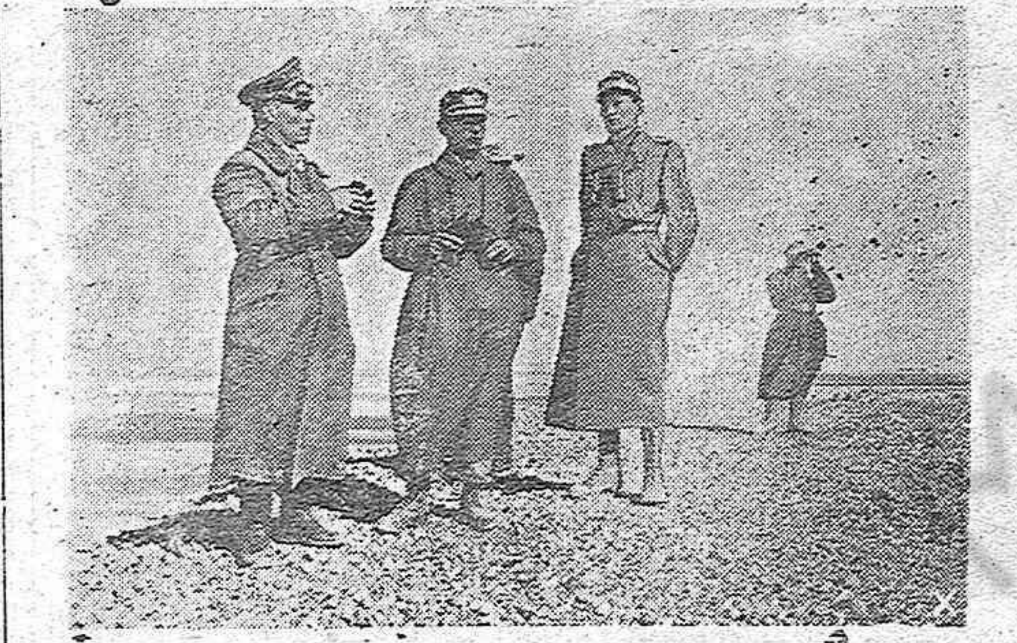
El Mariscal Rommel conversando con dos de sus oficiales en la zona de los combates de Africa

"¡Gente del alto llano numantino que guarda a Dios como cristianas viejas, que el sol de España os llena de alegría, de luz y de riquezas!".