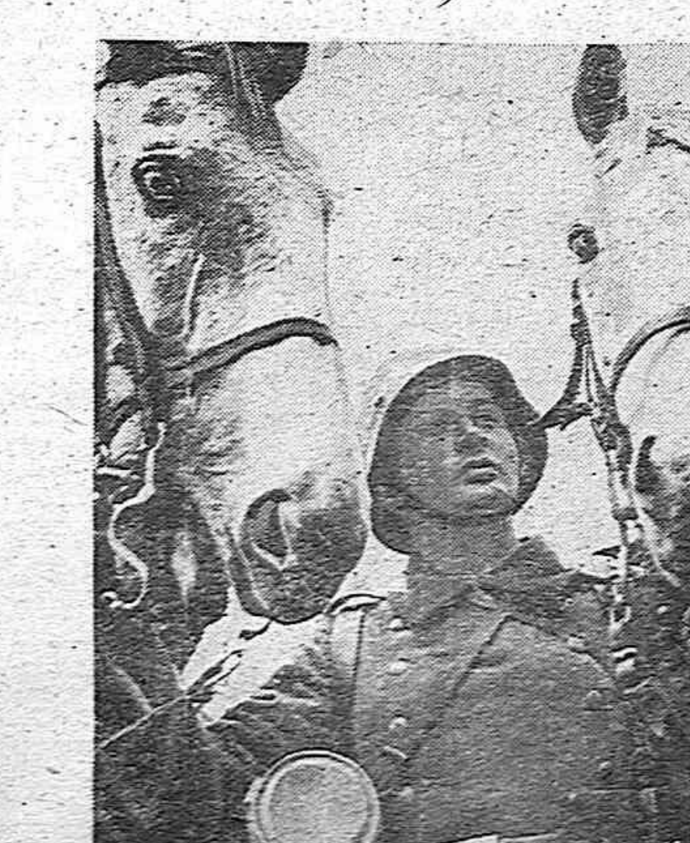
CON LOS SOLDADOS ALEMANES EN EL ESTE He aquí a un soldado con su fiel amigo, el caballo, durante un descanso en el frente del Este.