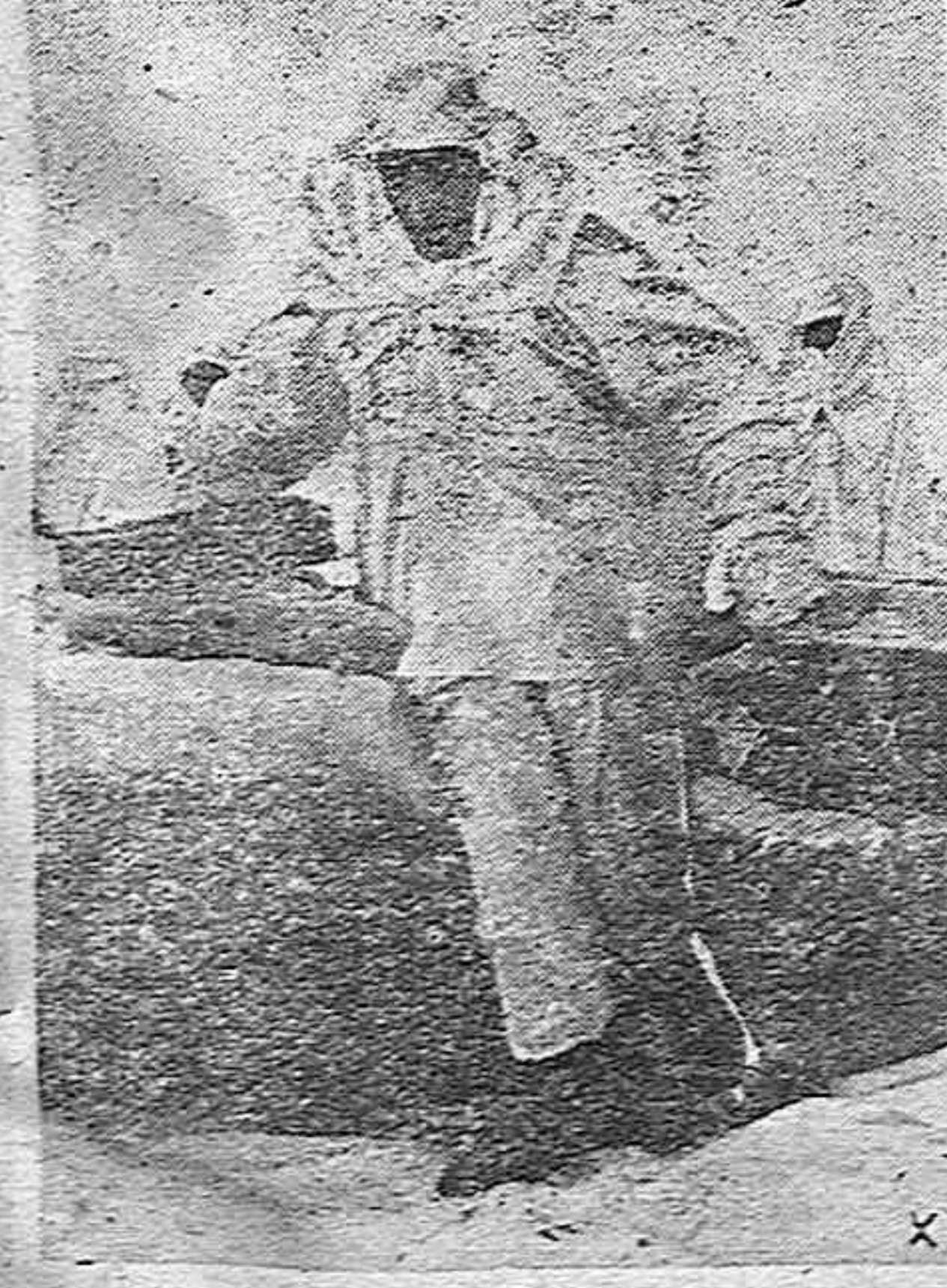
CON NUESTROS HEROICOS VOLUNTARIOS He aquí una patrulla de exploración de la División Azul en sus trajes de camuflaje.

Se advierte al público, y especialmente a comerciantes e industriales, que por el Ministerio del Trabajo no se ha concedido representación de la Revista que publica para solicitar anuncios de ninguna clase, debiendo poner a disposición de las Autoridades a los sujetos desaprensivos que con dicho objeto se les presenten invocando tal representación.