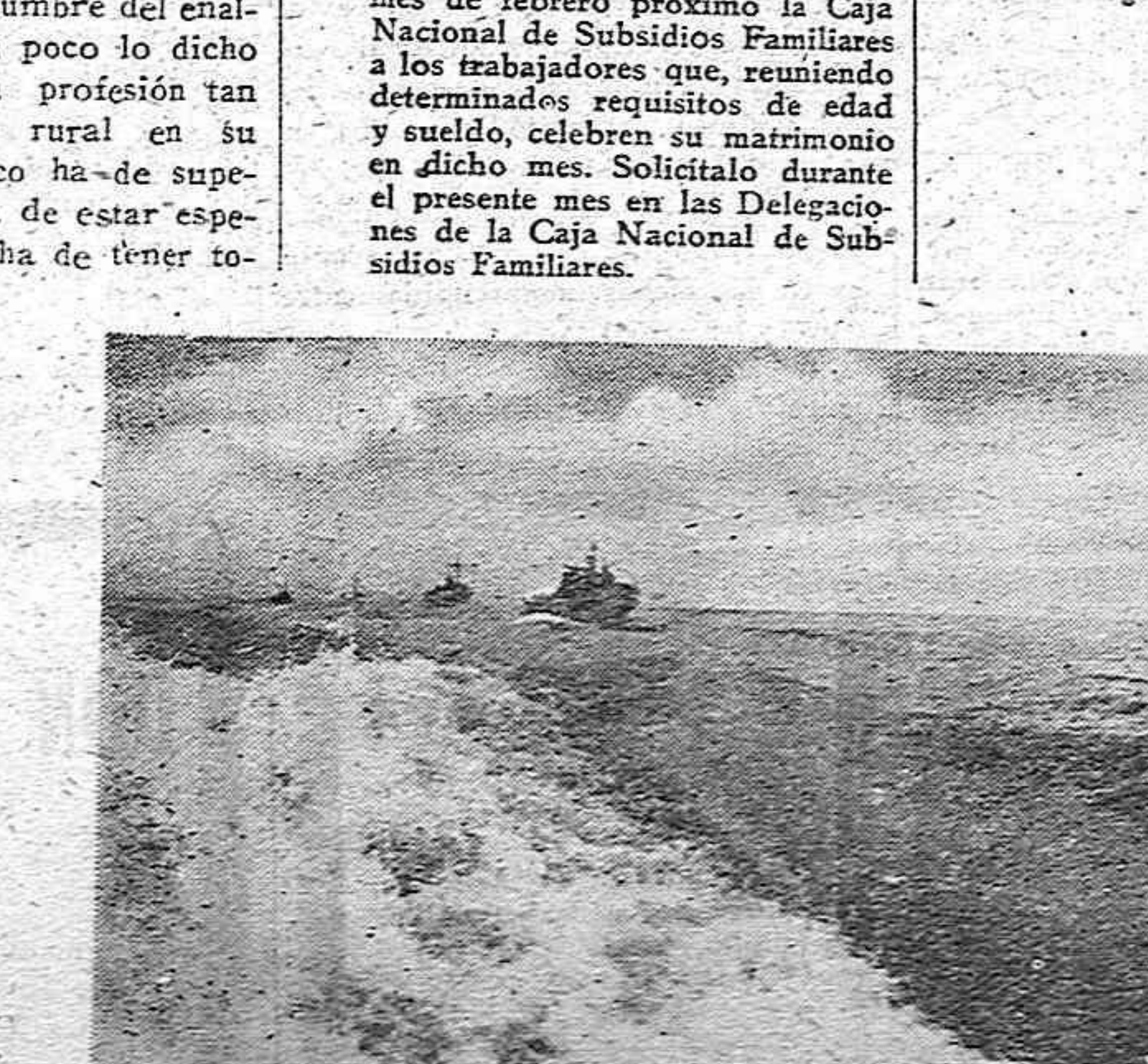
EN EL MAR DEL NORTE Lanchas torpederas alemanas en servicio de protección a buques de guerra, contra posibles ataques de los soviets.