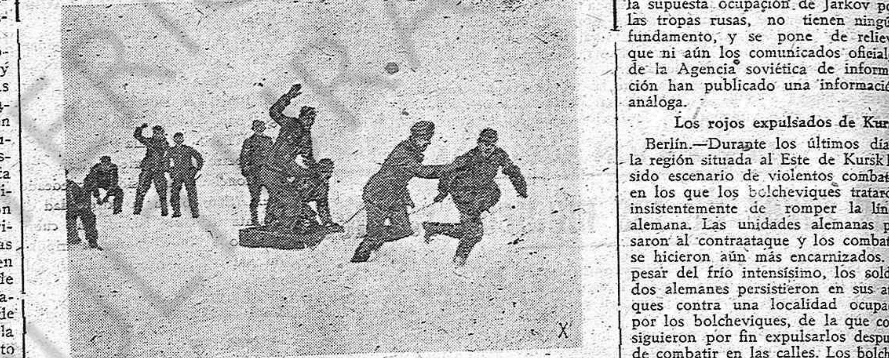
CON LOS SOLDADOS ALEMANES EN EL FRENTE DEL ESTE. Apesar del terrible frío y del duro servicio en el frente, los soldados alemanes conservan la alegría y el buen humor.

El citado diario, al comentar estas noticias del frente, declara que los éxitos logrados por los soldados del mariscal Mannerheim constituyen "una nueva y elocuente demostración de la falsedad de las informaciones que hablaban de una paz separada entre Finlandia y la URSS. Agradece que el ejército cumple con su misión y que la guerra contra los soviets no terminará más que con la derrota definitiva de éstos.